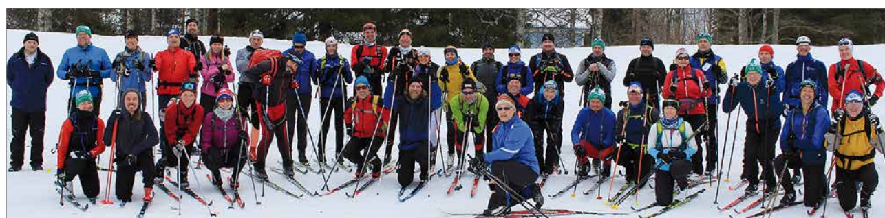
RR2 ryhmäkuva Ranualla Hotelli Ilveslinnan takana. Alkamassa on viides hiihtopäivä.