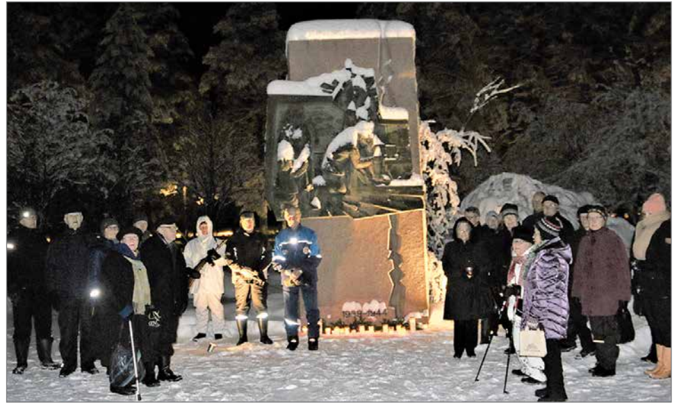
Talvisodan alkamisen muistopäivänä kokoontui reilut 20 henkeä aamulla seitsemältä sytyttämään Pudasjärven sankarivainajien muistomerkillä kynttilät.

Pudasjärven Sotaveteraanit, Pudasjärven Sotainvalidiin Veljesliitto, Pudasjärven kaupunki, Pudasjärven seurakunta ja Pudasjärven maanpuolustusjärjestöt jär-