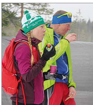
Mukana oli runsaasti nuorempaakin osallistujajoukkoa.

valtaosaa työpanostaan, tällaisen tapahtuman järjestäminen oli mahdotonta. Suuret kiitokset vapaaehtoisille heidän panoksestaan!