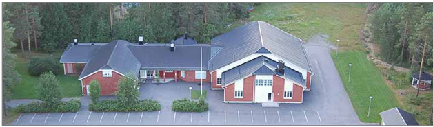
Sievin rauhanyhdistyksen ja Aseman seudun rauhanyhdistyksen yhteinen toimitalo sijaitsee Jyringin kylässä, jossa toimitaloa on vuosien kuluessa laajennettu useampaan kertaan.