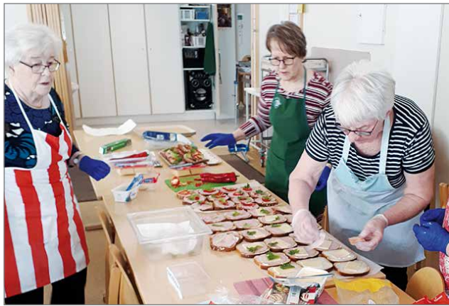
Emännät olivat laittaneet hyvät tarjottavat niin vieraille, kuin omalle väellekin.