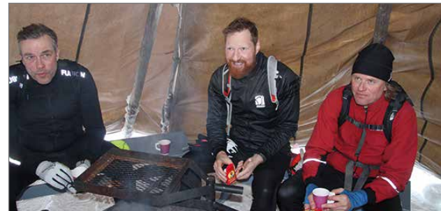
Tanskalaisia oli mukana neljän hengen ryhmä, jotka olivat ensi kertaa suksilla näillä lumilla. Tanskassa ei ole kuulemma lunta.