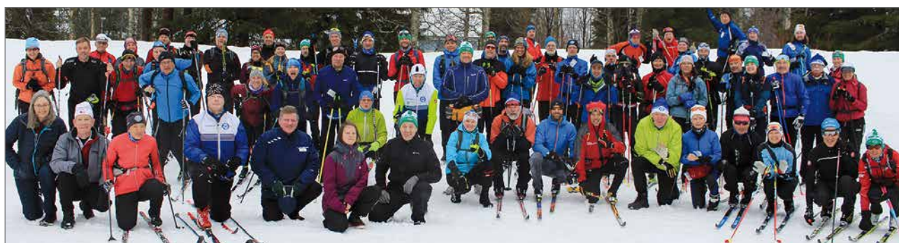
RR1 ryhmäkuva 9.3. Ranualla lähtöaamu, hiihdossa meneillään viides päivä.