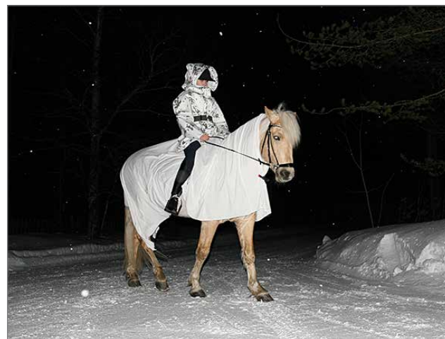
Suomenhevonen on kunniaavartiossa talvisodan päättymisen muistopäivänä.