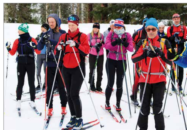
RR2 lähdössä 10.3. Ranualla 46 km päiväosuudelle. Ensimmäinen huolto oli Kiviojalla, Hukarin laavulla 21 hiihtokilometrin jälkeen.