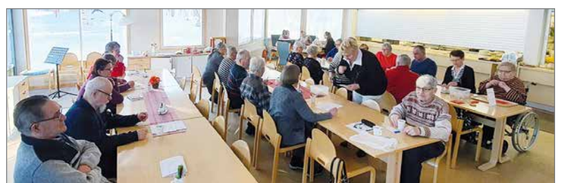
Yhdistyksen Kevätkokous veti väkeä paikalle ihan mukavasti.

Pudasjärven kaupungin ja Invalidiliiton tuet ovat mahdollistaneet retket sekä koulutukset.