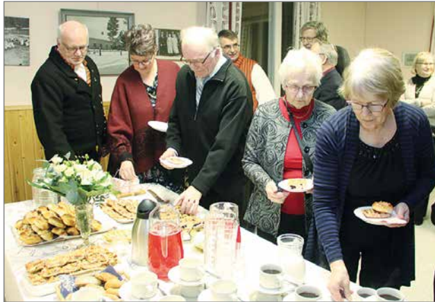
Juhla päättyi juhlakahveihin, keskinäiseen seurusteluun ja yhteiseen ilonpitoon.

teloesitys julkaistaan jossakin tulevassa Pudasjärvi-lehdessä kokonaisuudessaan.