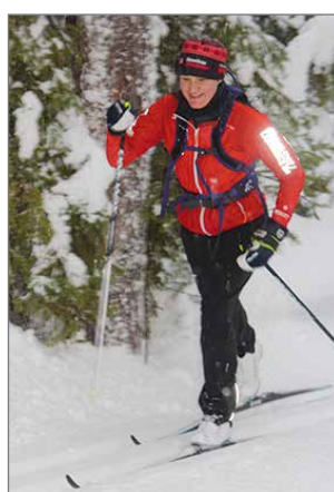
Hyvä tyylinäyte hiihtämisestä.

edustaa Lapin ja Pohjois-Pohjanmaan matkailussa vahvalla yhteistyöllä luotua vieraanvaraisuutta, jonka tarkoituksena on tarjota hiihtäjille kokonaisvaltainen luonto- ja kulttuurielämys.