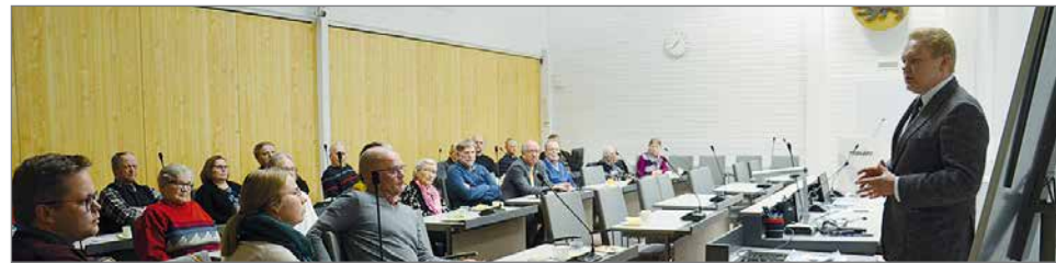
Perjantai-illan tilaisuuteen kaupungintalon valtuustosaliin kokoontui mukavasti väkeä kuuntelemaan Keskustan eduskuntaryhmän puheenjohtaja Antti Kurvinen terveisinä. Hänelle annettiin myös evästyksiä Pudasjärveltä mm. vastaanottokeskuksen säilyttämisestä.

Pudasjärvi-lehti, kuvat Olga Oinas-Panuma