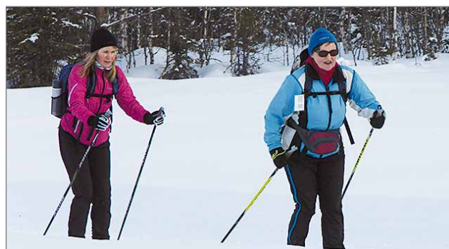
Päivän hiihtomatka viimeinen 10-kilometriä menossa Pikku-Syötteelle. Hiihtäjäpari Haukiputaalta kertoi hiihtäneensä ennen RR-tapahtumaa 1100 kilometriä.