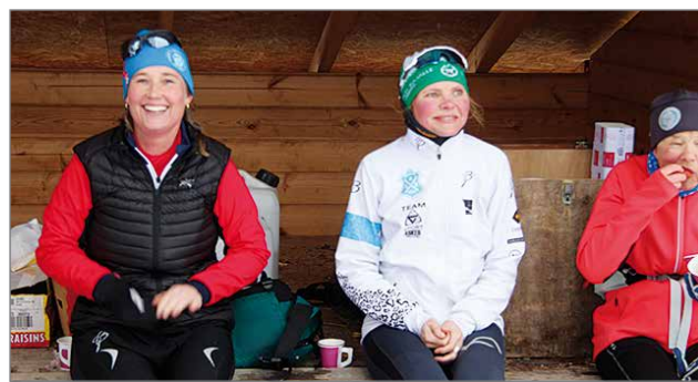
Ylimmäinen Pirinlammien laavulla ykkösryhmää. Lähtivät torstai 5.3 Kuusamosta ja olivat perillä Torniossa keskiviikkona 11.3.

Tunnelma tapahtumassa on aito, sillä hiihtäjät kohtavat huoltopisteissä paikallisia kyläyhdistyksiä, urheiluseuroja ja muita vapaaehtoistahoja. Toisinaan yhteistä kieltä ei ole, mutta asiat hoituvat molempipuolisella joustavuudella. Rajalta Rajalle -hiihto