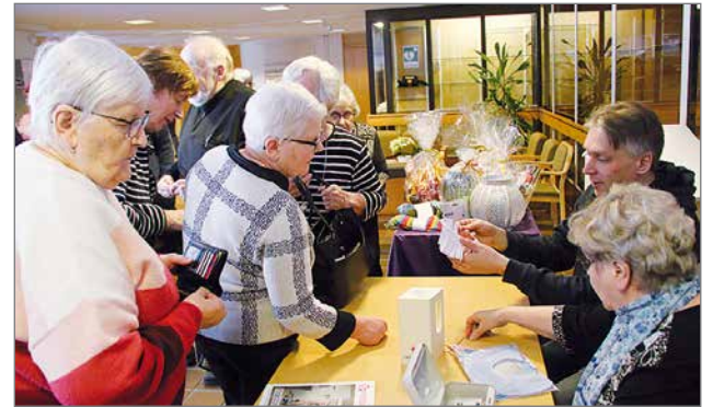
Yhteisvastuun hyväksi myytävät arvat menivät hyvin kaupaksi.

työssä yhteisvastuun ja keräyslistojen luovutus. Listoja on saanut myöhemmin ja saa edelleen diakoniatöistä. Kurenalalla järjestettiin lipauskeräyspäivä perjantaina 28.2. ja listakerääjät kiertävät kodeissa edelleen. Tämänvuotinen yhteis-