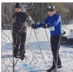
Alpo päätti voittaa.