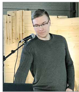
Timo Pesio Kontiotuote Oy.