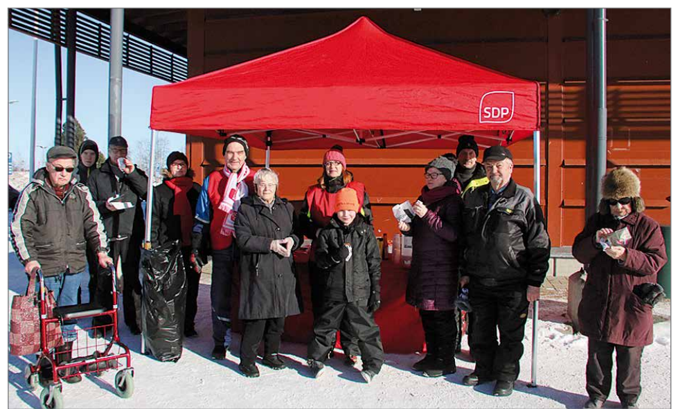
Grillimakkarat ja mehu maistuivat SDP:n Pudasjärven luottamushenkilöiden ja järjestöväen jalkautuessa kansan ja äänestäjien tavattavaksi aurinkoisessa maaliskuun alun säässä.

-Ulkoilmatapahtuma järjestettiin myös sen vuoksi, että muistutetaan olemassaolostamme ja toiminnastamme. Kuntavaalitkin ovat lähestymässä. Olemme kansan tavattavissa vaalien välilläkin, kertoivat tapahtuman järjestäjät. HT