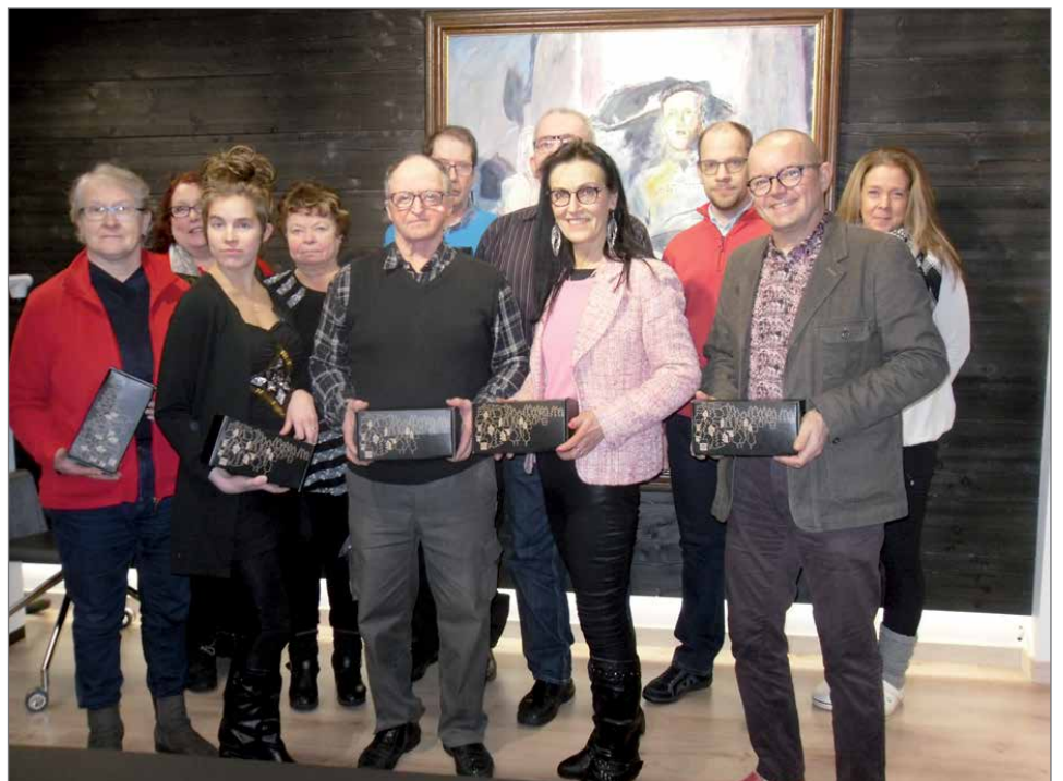
Hyvinvointivaliokunnan jäsenet saivat joululahjan vuoden viimeisessä kokouksessaan.