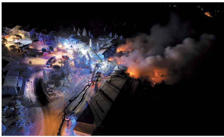
Hotelli Iso-Syöteen ravintolapääty paloi vielä seitsemän aikaan perjantain 21.12.2018 aamuna.

Hotellin varustilanne talvelle oli erittäin hyvä. Tä-