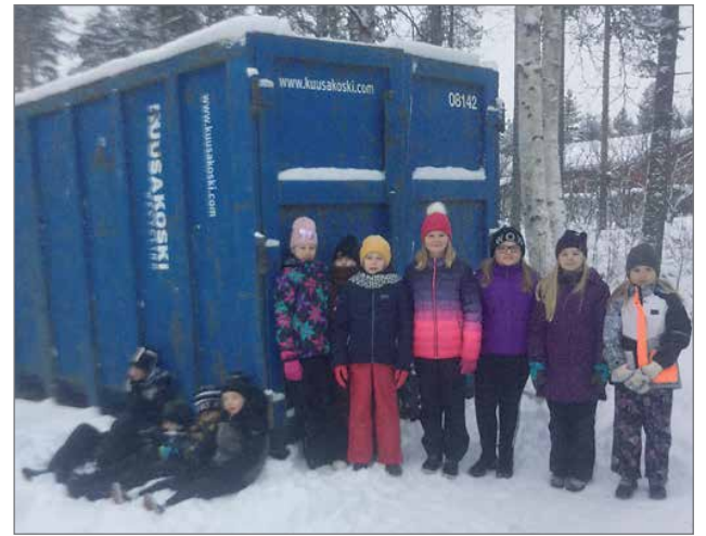
Lakarin koululaiset toivovat runsaasti metalliromua kuvassa näkyvälle lavalle.