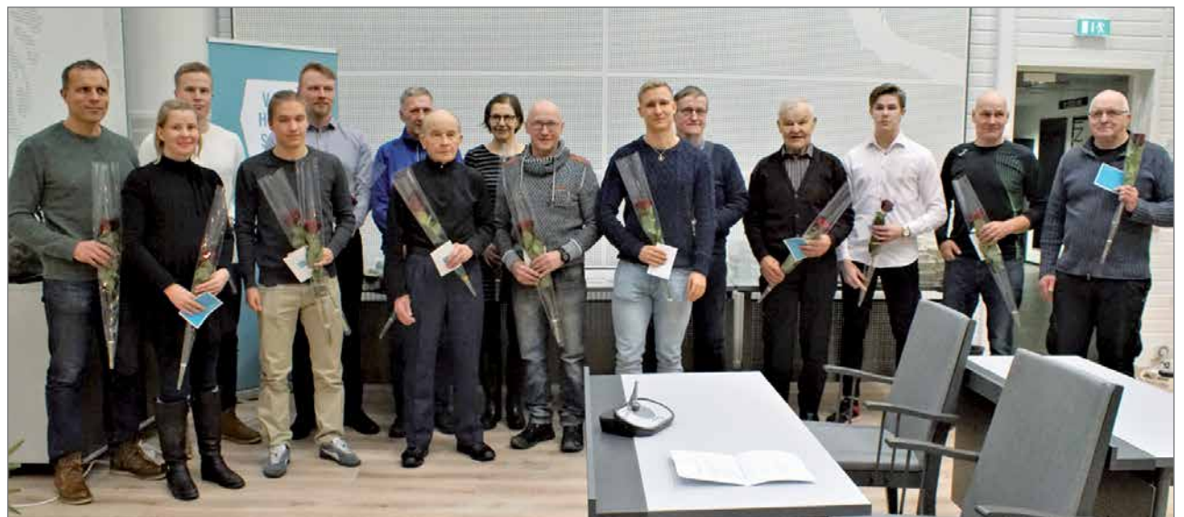
Paikalla olleet palkitut urheilijat yhteiskuvassa.