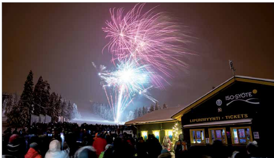
Näyttävää ilotulitusta oli seuraamassa arviolta yli tuhat henkeä.

Riecki otti esille myös joulunajan järkyttävän uutisen Hotelli Iso-Syötteen tulipalosta.