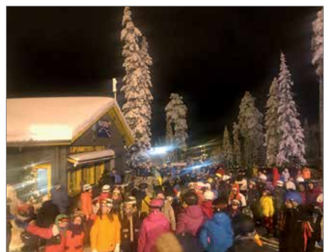
Iso-Syötteelle kokoontui yli 1000 henkeä ottamaan Uutta Vuotta vastaan.

Kaupunki on viimeaikaisilla päätöksillään sitoutunut rakentamaan Hiihtokeskus Iso-Syötteen välittömään lähiseisyyteen sisäliikunnan harrastamiseen ja erilaisien tilaisuuksien järjestämiseen soveltuvan kiinteistön, työnimeltään Syöte Areenan. Areenan rakentamiseen kaupungilla on valmius jo tulevina keväänä lumien sulettua. Jos kaikki tekijät Areenan osalta menevät siten, kuin on