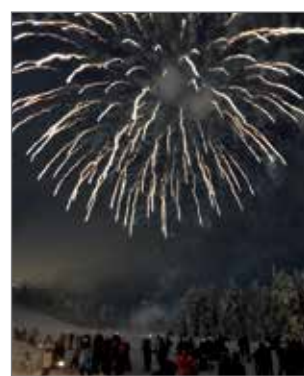
Vuoden vaihtumisen kruunasi rinnepäällikkö Vesa Salmelan ampuma komea ilotulitus.

Puheessaan Rieki kertoi Syötteen puitesopimuksessa kaikkien osapuolten sitoutuneen alueen kehittämiseen ja omalta osaltaan myös investointeihin. Yhteisenä tavoitteena Syötteen matkailun kehittämistä on, että seuraavan kymmenen vuoden aikana Syötteen alueen hotellitarjonta, majoitus, ravintola, vapaa-ajan harrastus ja edelleen myös lasketteluun ja talveen liittyvien mahdollisuuksien tarjonta