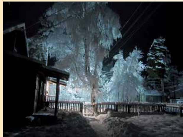
Maa on niin kaunis Tikassa.

Jouluaattona kävi Joulupukki vierailmassa ja jakoi vastaanottokeskuksen järjestämät lahjat lapsille. Hyvin pukki selvisi kieli-