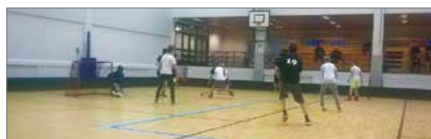
Kymmenen salibandyjoukkuetta Oulun seudulta kohtasi Tuomas Sammelvuo -salissa uuden vuoden turnauksessa.