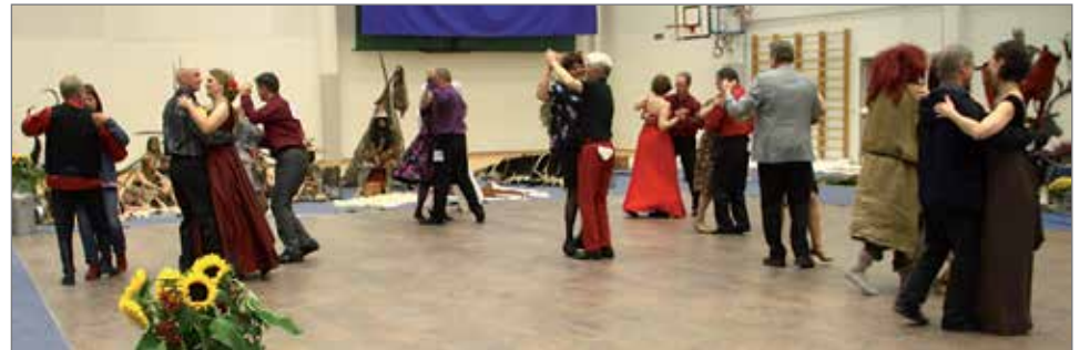
KurenTanssi-tapahtuma on noussut jo perinteiseksi tanssitapahtumaksi, joka seuraavan kerran järjestetään tämän hetken tiedon mukaan reilun vuoden kuluttua helmikuussa. Kuva viime syksyn tapahtumasta.