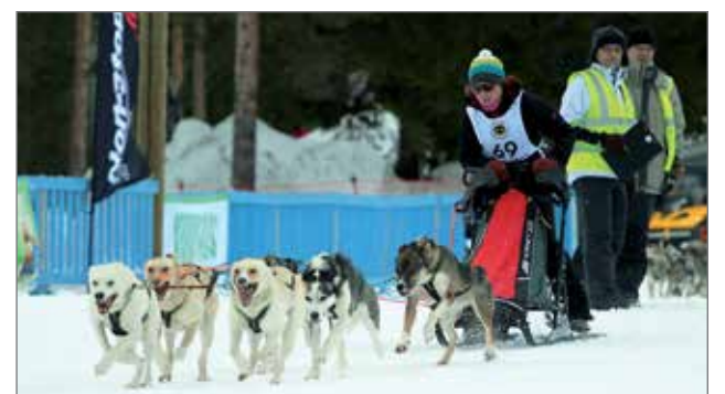
Koiravaljakot kisasivat viime vuonna Taivalkoskella. Kelosyötteellä nähdään 9.-10. tammikuuta useita suomalaisia MM- ja EM-tason kilpailijoita niin hiihdossa kuin valjakkajossakin.

Paikalliset yrittäjät lähtivät innokkaasti mukaan tu-