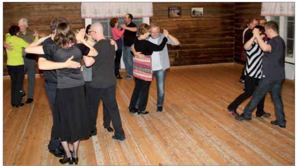
Pudasjärven Nuorisoseurantalo Koskenhovilla on moni pudasjärveläinen saanut taitoa ja tietoa tanssiharrastukseensa.