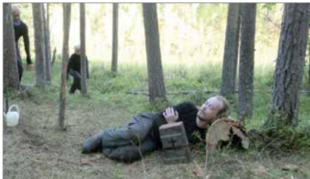
Ensi viikolla Suojalinnalla aloitetaan kylänäytelmien suunnittelu. Ideoita näytelmien pohjaksi haetaan paikallisista tarinoista eri puolilta pitäjää ja ehkä pientä mystiikkaakin on luvassa. Kuva teatteria tunturijärjellä pienoisnäytelmästä Lapin erämaissa vuosina 2014-18.

Mukaan toimintaan voi osallistua, vaikka ei haluaisi esiintyä, sillä harrastajia tarvitaan myös esimerkiksi lavasteiden, tarpeiston, puustuksen ja käsikirjoitusten ideointiin sekä toteutukseen.