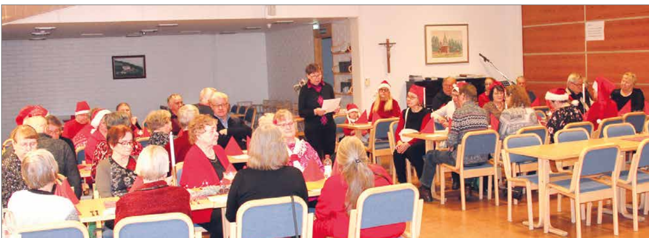
Invalidiyhdistyksen pikkujoulu keräsi ennätysmäärän jäsenistöä viettämään yhteistä joulujuhlaa.