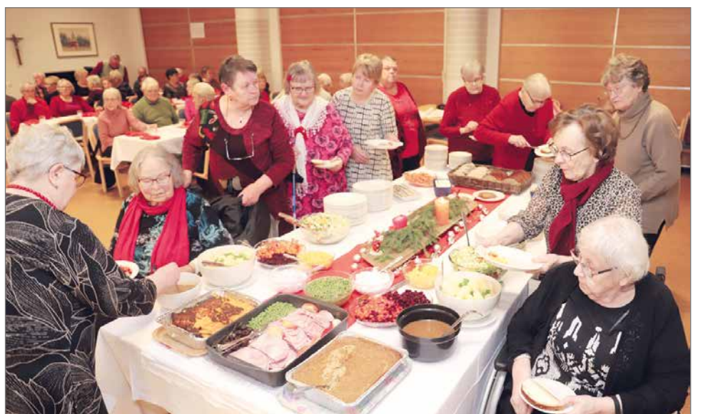
Jouluruokailun tarjoaminen jäsenille pienellä omavastuulla on yksi Sydänyhdistyksen toiminnan vuosittainen kohokohta.