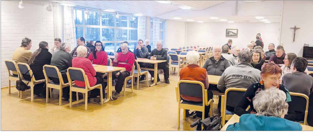
Kivarin Erän hirvipeijaisissa juttu luisti käristystä odotellessa.