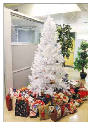
Sydänkorteilla täytetyt joulukuuset tyhjenivät tänä vuonna nopealla tahdilla ja paketit päätyivät hienosti LähiTapiolan kuusen alle.