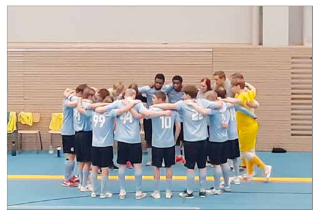
Fanin katsomosta ottama kuva joukkueesta.

Joutsassa saatiin aikaan mahtava tunnelma, kun molemmilla joukkueilla oli iso joukko kannattajia. Harmillisesti Kurenpojat ei pystynyt omilleen antamaan tällä