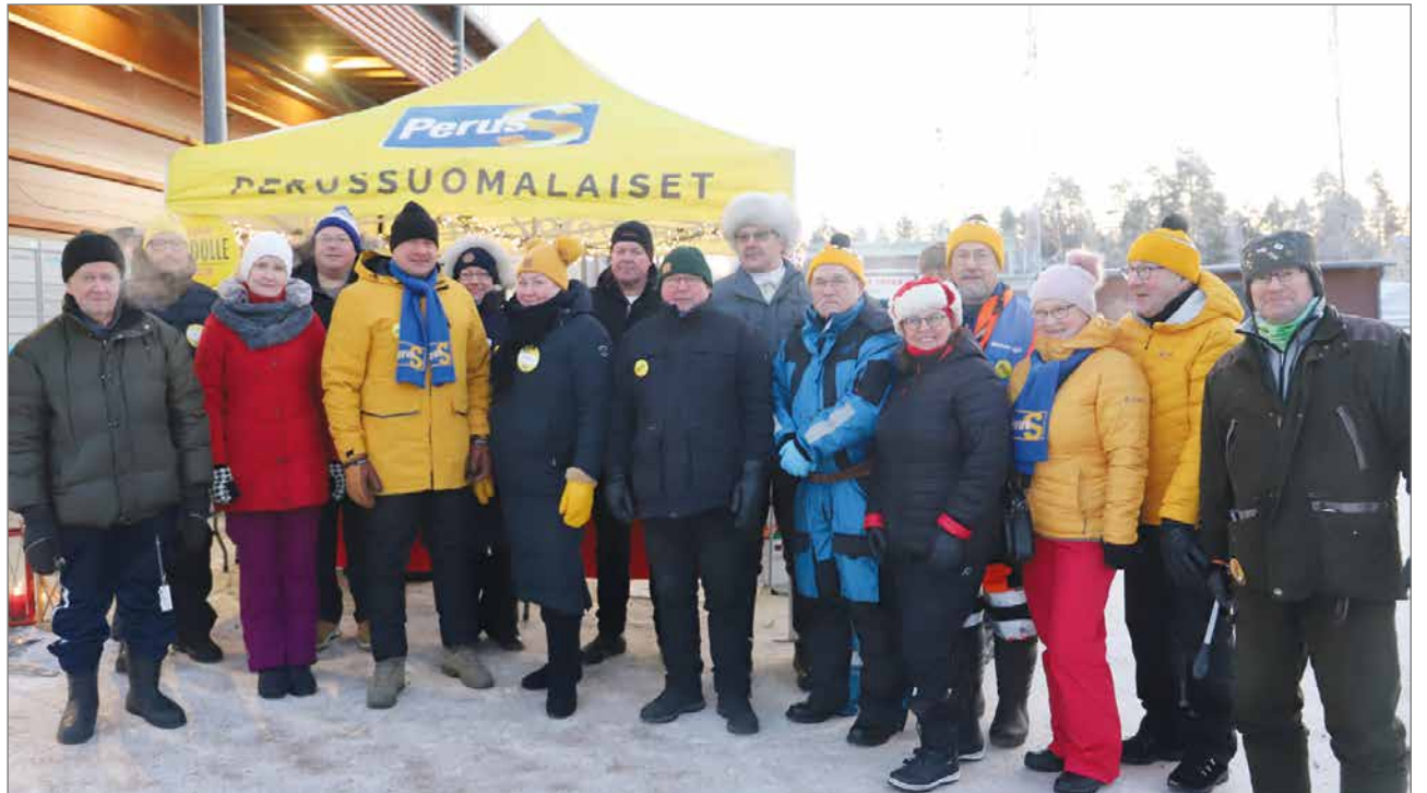
Pakkasesta huolimatta vaalitelttalla kävi mukavasti väkeä.

-Vuosien "velaksi elämisen kulttuurin" muuttaminen säästö- ja järkitalouden kulttuuriksi sekä muiden poliitikkojen ja virkamiesten mielenmaiseman kääntäminen tähän, on vaatinut perussuomalaisilta taitavaa politikointia ja selkeää talousjohtamista. Suomen hallituksen linjaukset ovatkin hyvä pohja myös kuntien talouden pohjaksi. Saamme olla ylpeitä osaavista perussuomalaisista sekä eduskun-