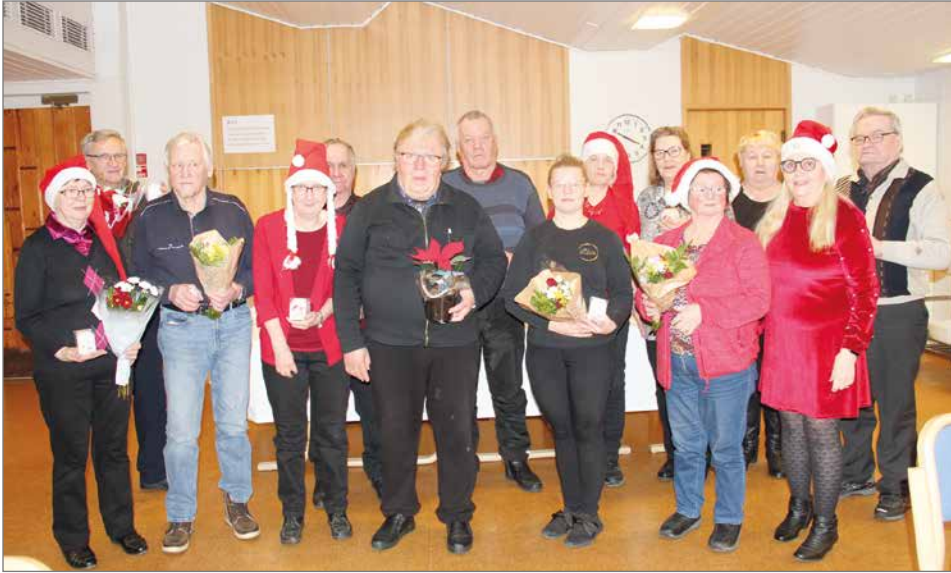
Invalidiyhdistys muistaa aktiivisia talkoolaisia sekä yhteistyökumppaneita.

Päätössanat lankesivat yhdistyksen sihteeriin harteille. Hän kiitteli menneestä vuodesta ja muistutti tulevasta tapahtumasta, kuten Mikko Alatalon Joululaulukonsertista sekä huhtikuussa vietettävästä yhdistyksen 50-vuotisjuhlasta. Puheessaan sihteeri kiitteli kaikkia lämminhenkisestä joulujuhlasta ja toivotti turvallista