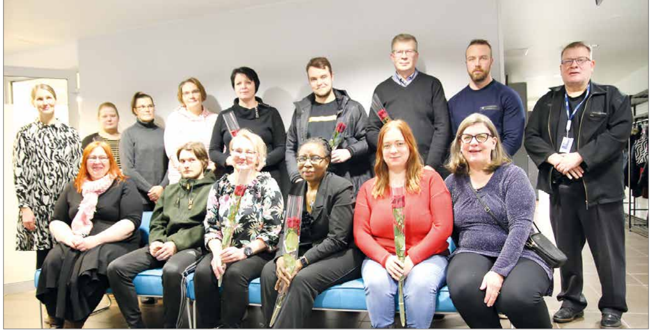
Vuoden kolmannet valmistujaiskahvit juotiin joululoman kynnyksellä.

Joululoman kynnyksellä juhlittiin viiden lähihoitajan, neljän sähköasenta-