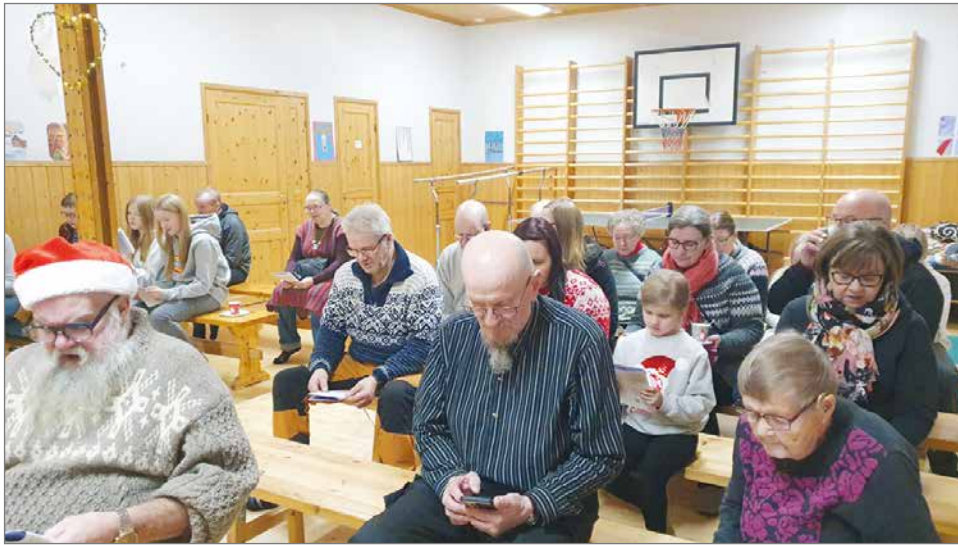
Yleisöä laulamassa Kauneimpia Joululauluja entisellä Virtalan koululla.

keten laulettiin myös Joulupukki laulua, ja niinhän siinä kävi, että itse Joulupukki saapui paikalle tuoden terveisiä Korvatunturilta ja muistamisia lapsille. Siuruan kyläyhdistys tarjosi mukana olleille torttukahvit, mehua ja pipareita. Lämmin kiitos kaikille osallistumisesta, Pudasjärven seurakunnalle ja Hankkilan perheelle.