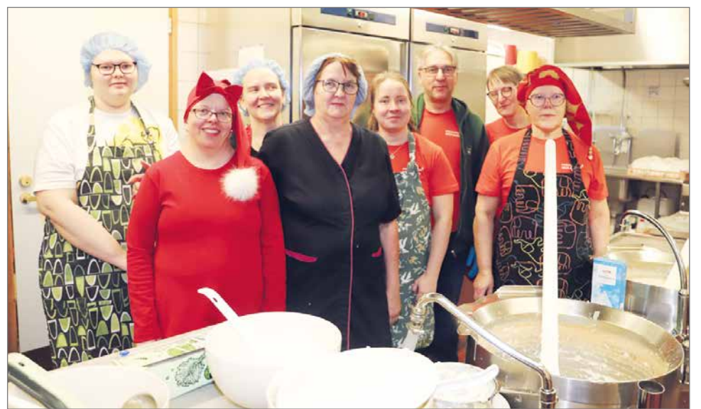
Kaikki seurakunnan työntekijät olivat puuropäivänä töissä. Puolen päivän aikaan kuvaan ehti tällainen tonttujoukko.

Puolen päivän jälkeen kello 13.30 seurakuntasali täyttyi Kauneimmat joululaulut tapahtumasta. HT