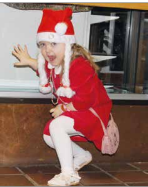
Tarkkailijatonttu tärkeässä tehtävässään!