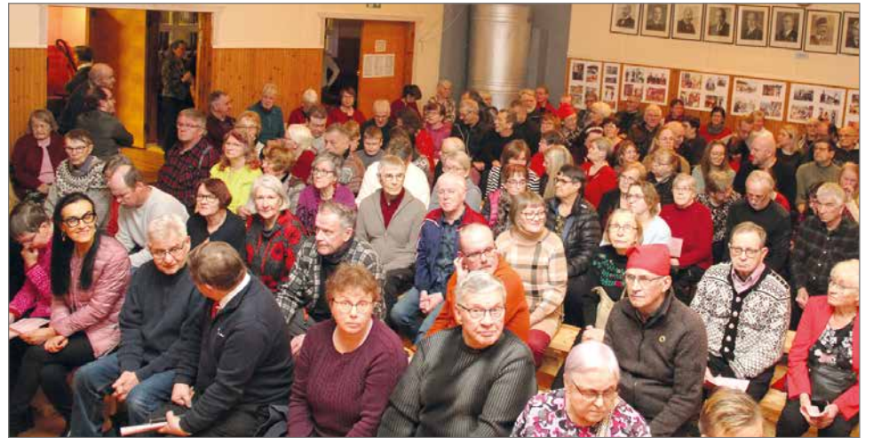
Hyvissä ajoin ennen konsertin alkamista istumapaikat täyttyivät ja jouluinen tunnelma tuli saliin.