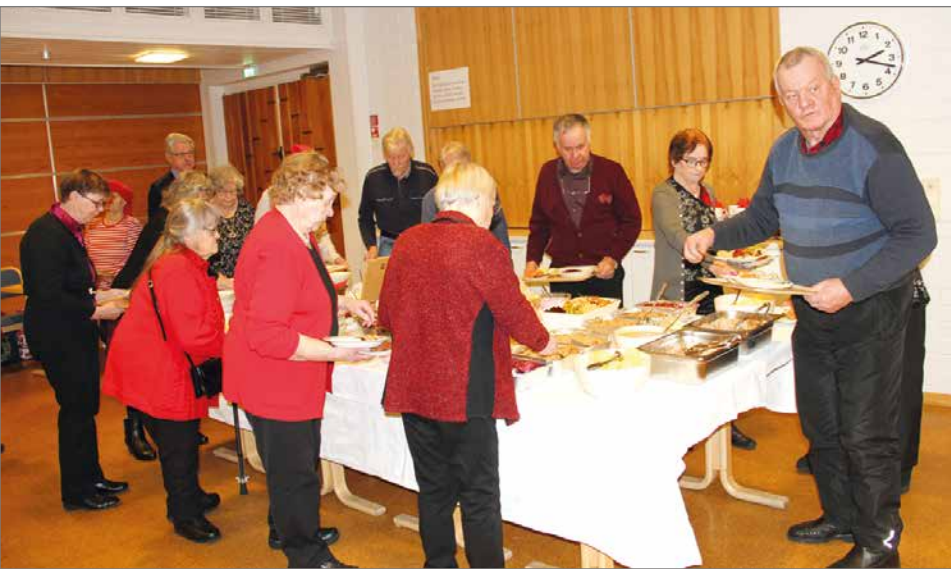
Joulupöydän antimet houkuttelivat väkeä jonoksi asti.