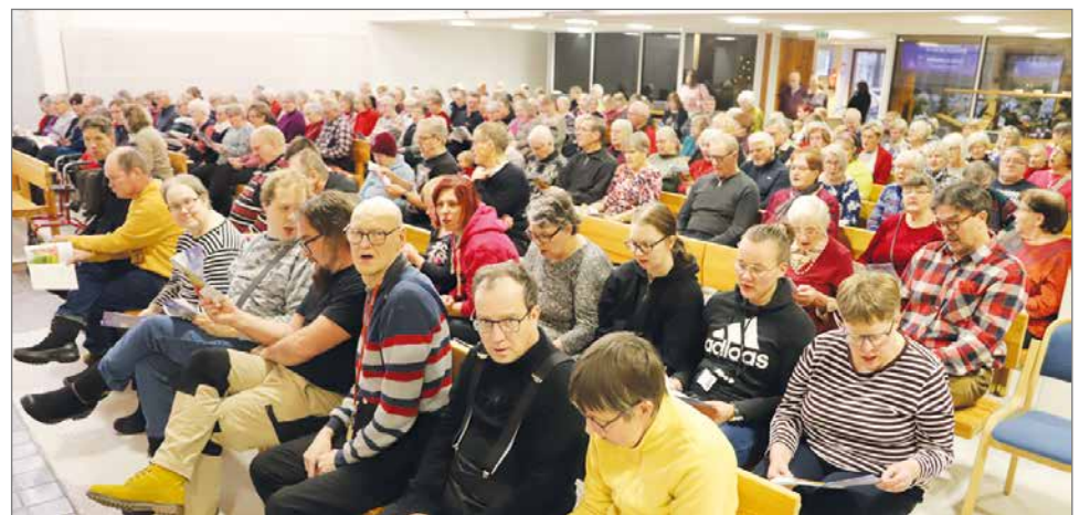
Kauneimmat joululaulut -tilaisuus puurotapahtumassa kokosi seurakuntasalin täyteen väkeä.