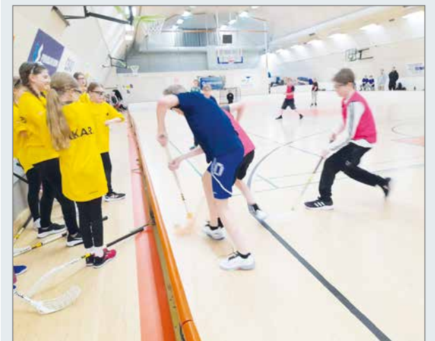
Koillismaan alakoulujen salibandyturnauksesta Pudasjärvellä tuli hopeamitalit.