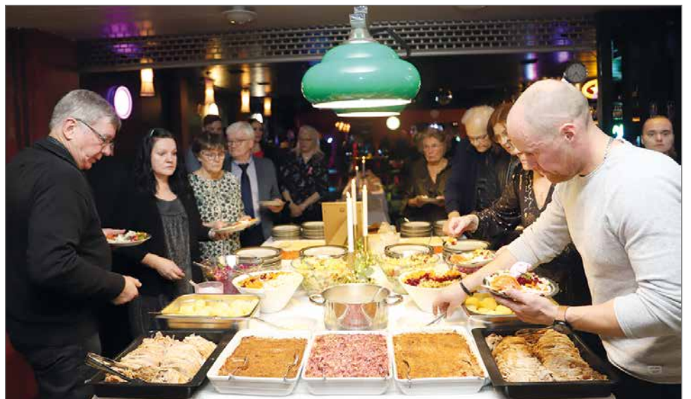
Kakku- ja Pitopalvelu Vengasahon pikkujoulun aterialta tuli paljon kiitosta ja myönteistä palautetta.