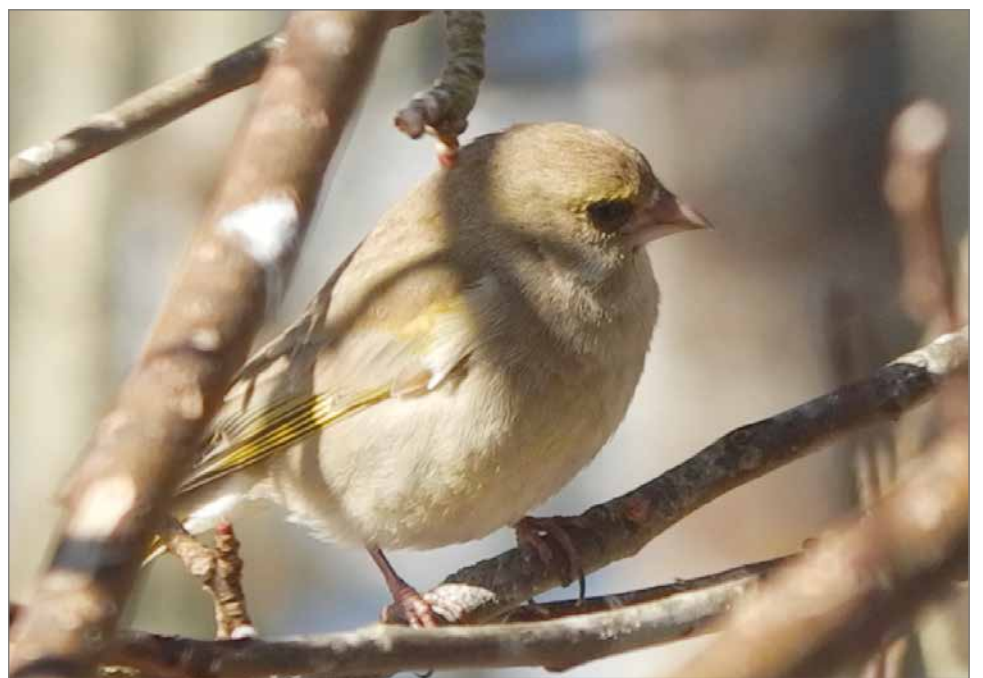
Viherpeipot muuttivat menneinä vuosikymmeninä etelämmäksi Keski-Eurooppaan talveksi. Ilmaston lämpenemisen vuoksi yhä useampi viherpeippo uhmaa talvea ja yrittää talvehtimistä Suomessa.

sinnittelijöitä ovat esimerkiksi pieni osa rastaista. Monet vesilinnut lähtevät muutolle vasta vesistöjen jäätyessä.