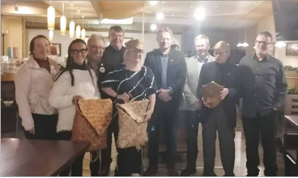
LC Pudasjärven jäsenet vierailivat naapuriklubi Hilimojen kokouksessa ja saivat mukaansa klubeissa kiertävän Arne Ritari kilven.