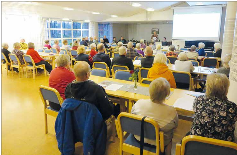
Jäsenistöä saapui kokouspaikalle kaikkiaan 45 henkilöä.