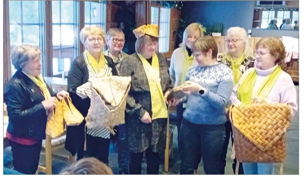
LC Pudasjärvi Hilimat kävivät viime huhtikuussa ryöstämässä Kilven Kuusamosta Pohjanakat klubista.