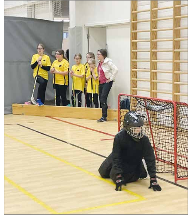
Maalissa sai olla kärppänä.

Tytöt: 1. Lakari 5 lk, 2. Hirsikampus 6lk, 3. Hirsikampus 5lk