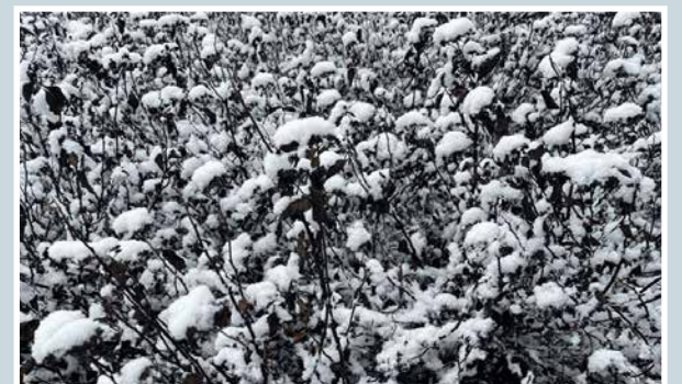
Tulihan se talvi!

Martti Kähkönen lukijoiden palaute ja jutut: vkkmedia.fi