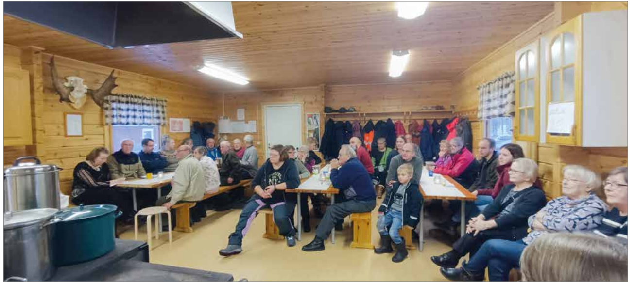
Metsurin mitta näytti peijaisvieraita käyneen yli 120 henkilöä oman väen lisäksi.

senten ja kyläläisten lisäksi alueen vapaa-ajan asukkaat ja vieraslupan ostaneet väljällä skaalalla. Vieraita alkoi saapua tasaiseen tahtiin heti ilmoitetun ajankohdan koittaessa. Kapustan varressa toimivat hirvenpyytäjät lasitasivat maukkaaksi keuhutun kääristyksen lisäksi lautaselle perunoita. Sitten kukin vieras valitsi sopivia lisukkeita punajuuriin, suolakurkkujen ja muiden tykötärpeiden joukosta. Perinteinen Siirin valmistama kotikalja näytti olevan suosituin ruokajuomana. Monet vieraista näyttivät hakevan santsia, mikä huomioitiin järjestäjän puolelta kunnia-asiana. Osoittihan se syötävän olleen ihan syömäkelpoista. Jälkiruokana tarjottiin kahvia leipäjuuston ja nisun kera Tapahutuman luonteeseen kuuluu olennaisena osana vanhojen tuttuja tapaamisia ja kuulumisten vaihtamista. Voitiinpa siinä sivuta päivänkohtaisia asioita ja ehkä puhua malliksi politiikkaakin. Lämminhenkistä ja huumoripitoista ajatusten