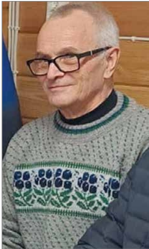
Tuli herra Kainuusta ja tyhjensä lähes koko arvontapöydän ostamallaan kuudella arvalla. Vei viisi voittoa pesimistipitäjään.

Lauantain ohjelmassa oli sitten varsinainen juhlapahtuma, johon oli kutsuttu maanomistajien, yhteistyökumppaneiden, seuran jä-