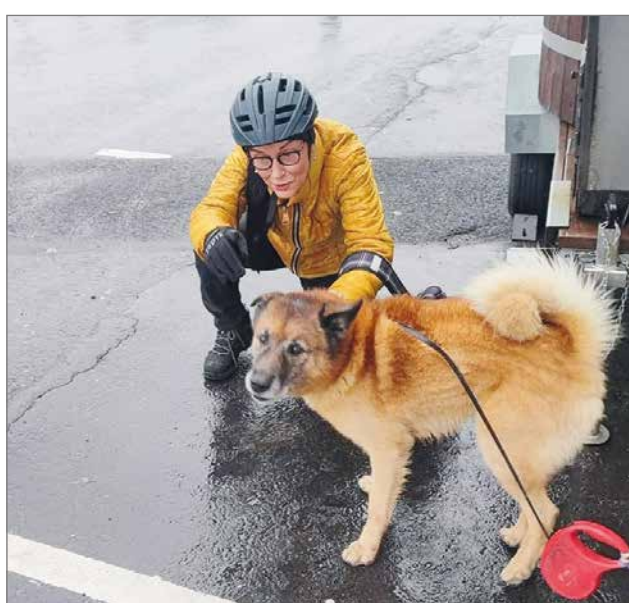
Jeri-koiran ja Sointun riehakas lenkkitapaaminen.

Joidenkin tutkimusten tuloksena on todettu, että eläimen kohtaamisesta saataava ihmisen psyykinen tuki saattaa olla varsin vaikuttava ja mitattavissa jopa hänen hormonierityksensä keinoin. Kohtaamiseen riittää eläimen koskettelu silittämällä tai taputtelemalla. Kokemus on osoittanut, että iäkkäimpien henkilöiden elämäntahti, aktiivisuus arkeen ja liikunnan harrastamiseen lisääntyvät eläimen läsnäololla. Kaikki ihmisryhmät lapsista vanhuksiin voivat saada eläimiltä apua ja turvaa erilaisiin henkisiin ja kehollisiin vaikeuksiinsa. Tarvitsee vain haluta/uskaltua antautua ottamaan vastaan eläinten aito läsnäolo, viisaus ja opetukset. Eläimet ovat kuuluneet ihmisen elämään erilaisissa rooleissa ja tehtävissä tuhansia vuosia. Nykyisin maailmaa myllertä-