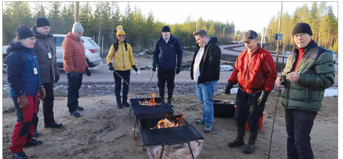
Grillimakkarat maistuivat Nivankankaalla kävijöille.

Alueelle on rakennettu Nivanraitti niminen tie, jonka vierellä kulkee myös kevyenliikenteenväylä. Nivanraitti toimii alueen halki kulkevan kokoojatienä, josta kuljetaan