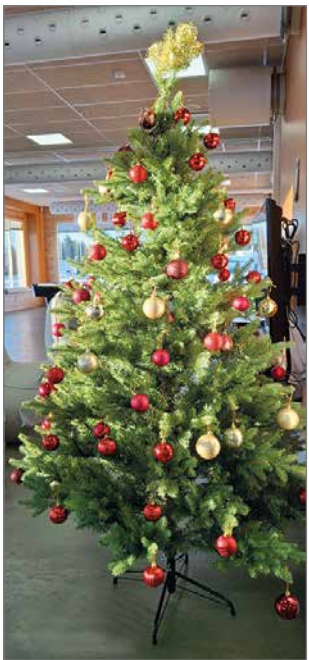
Joulukuusi oli muistuttamassa joulun lähestymisestä.

Kurenalan Kyläyhdistys syyskokouksi sunnuntaina 24.11. Pirtin Nuorisotiloi- sa. Paikka on ihanteellinen ja kuusikin oli tuotu sisälle. Joulutorttuja, piparia ja suk-