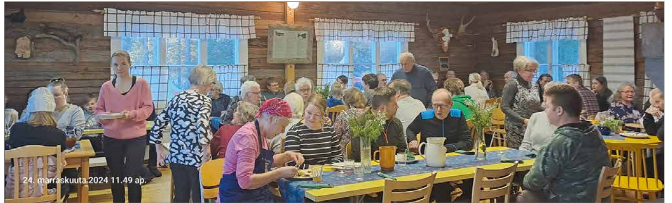
Metsälän kylätalolle kokoontui noin 70 henkeä hirvipeijaisiin.