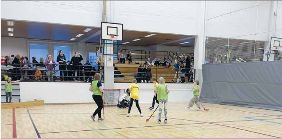
Liikunnan iloa alakoulujen salibandyturnauksessa.

- Sujui oikein jouhevasti. Väkeä oli varmasti kaikkiaan toista sataa, ja loppupelien aikana katsomot olivat lähes täynnä, joten saattoi