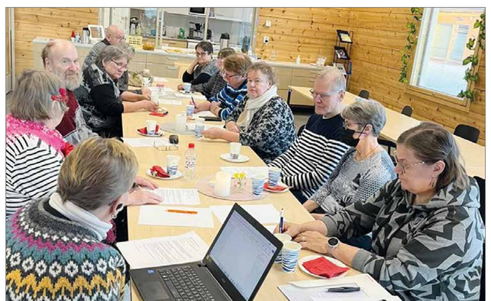
Pirtin nuorisotila on ihanteellinen paikka järjestää kokouksia ja tilaisuuksia.

Tuleva joulunavaus on ilman Kurenalan kyläyhdistykseltä kysymistä päätetty pitää aikaisemmista vuosista