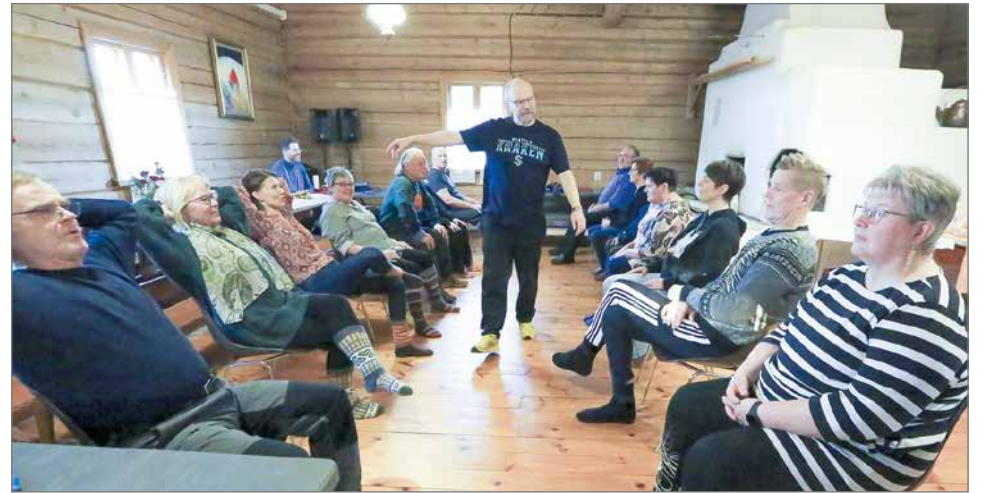
Askanmäen näyttelijäntönnön kurssille osallistui harrastajateatterinäyttelijöitä lähinnä Puolangalta ja Pudasjärveltä.

- Kauhean lahjakas ryhmä, helposti innostuva ja nauravainen. He ovat valmiita tekemään sellaisia-kin harjoituksia, mitä eivät varmaankaan ole koskaan tehneet. Hän nosti näyttelijäntönnön tekemisessä esiin jännittämisen merkityksen. Hänen mukaansa jännitys on yksi syy, mikä ajaa ihmisen näyttämölle. Yleensäkin