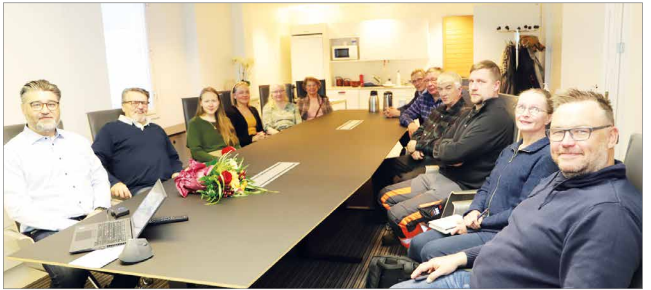
Yrittäjien aamukahveille Pohjantähteen osallistui 16 yrittäjää.

-Apetitin kasvis- ja ruokapakasteet valmistetaan Säkylän vihannes- ja ruokapakasteitehtaan. Noin 140 sopimusviljelijää viljelee vuosittain yli 30 miljoonaa kiloa kotimaisia kasviksia pakasteiksi. Yhteistyöllä sopimusviljelijöidensä kanssa on luotu Vastuuviljelymenetelmä, jota kehitetään jatkuvasti Apetitin omalla Räpin koetilalla. Kirkkonummella sijaitseva kasviöljypuristamo on Suomen suurin. Öljypuristamossa jalostetaan rypsin ja rapsin siemenistä laadukkaita ja korkean jalostusarvon tuotteita kasviöljyiksi, puristeiksi ja elintarvikkeikäyttöön rypsinsemenjauheeksi.