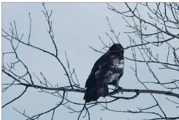
Suolla pesivien keltavästäräkkien, niittykirvisten ja kahlaajien pesät ovat alttiita pesärosvoille. Suon reunamilla pesivät korpit, varikset ja haukat saalistavat säännöllisesti linnun poikasia sekä munia.

Alueen soilla on varsin monipuolinen hyönteislajisto kuten monia suoperhoslajeja. Valitettavasti eteläisen Suomen luonnontilaiset suot ovat hävinneet lähes kokonaan. Jäljellä olevat suot ovat