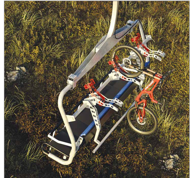
Kesäisin jokaiseen tuoliin asennetaan pyörätelineet, yhteensä hissiin mahtuu kerrallaan kolme pyörää ja kolme pyöräilijää. Hissiiä voivat käyttää myös jalankulkijat.

Työmaa käynnistyy jo toukokuussa. Ala- ja yläasemien rakentamisen jälkeen pystytetään hissipylväät ja rakennetaan asemien sääsuojat. Viimeisenä vedetään hissivaijeri ja asennetaan tuolit paikalleen. Kun laite on valmis, alkaa testaus, tarkastukset ja koulutukset. Kaikki on valmista elokuun