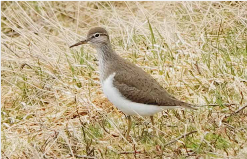
Muuttoaikaan suon monilla lampareilla levähtää niin vesilintuja kuin kahlaajiaakin, kuten tämä rantasipi.

Myös Säynäjäsuoilla on lukuisia pieniä lammikoita,