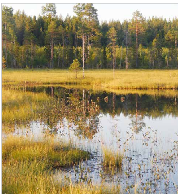
Säynäjäsuo on varsin heinäinen ja sarainen. Lampareiden vesi tulee sadevesien lisäksi alueen runsaista pohjavesistä. Paikoin pohjavedet purkautuvat maan pinnalle lähteensilmäinä alueen muillakin luonnontilaisilla soilla.