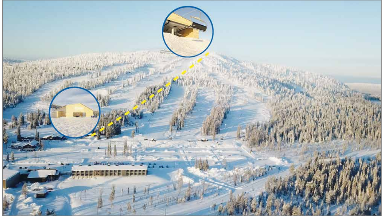
Hissin ala-asema tulee sijaitsemaan Iso-Syötteen Lumimaan ja vuokraamorakennuksen välissä, yläasema aivan tunturin huipulla.

Törmälä kiittelee sujuvasta työstä omaa tiimiään,