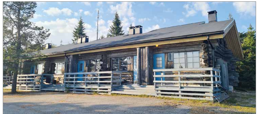
Syötteen Huipuntupien hirsiset rivitalot ovat valmistuneet 1987 ja viimekesänä ikänsä päähän tulleet kattorakenteet korjattiin taivalkoskelaisen Pesiölä Oy:n toimesta.

- Ei ollut ihan pikkujuttu tuoda perinteiseen miljööseen uusia turvallisuusvaatimuksia. Pesiölä hoiti remontin ja yritystä voi vain kehua lopputuloksesta. Nostan hattua myös taloyhtiön hallituksen työlle läpi koko prosessin. Ja arkkitehtimme