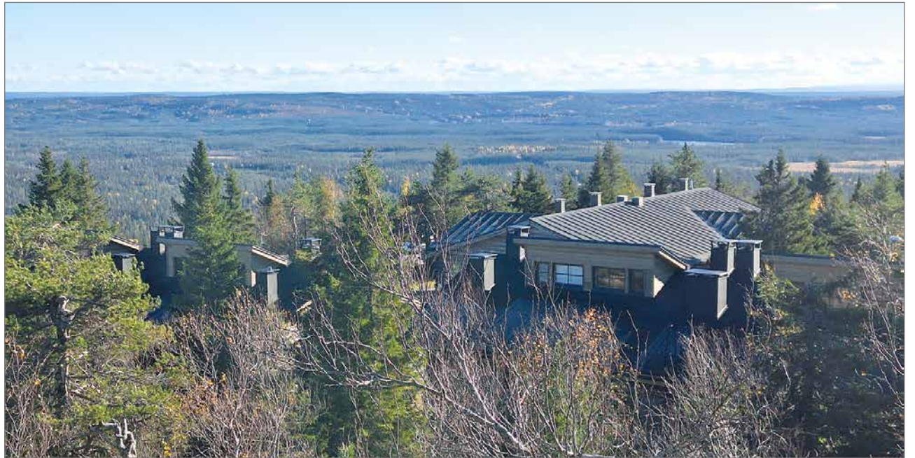
Kaksi rivitaloa eli kaikkiaan kymmenen osaketta saivat uudet valoa ja avaruutta tuovat kattoikkunat.

Väisänen kertoo yhteistyön osoittavan, että Syötteen Tunturikylän rakennuksia voidaan uudistaa hyvällä maulla, rikkomatta arvokasta ja herkkää ke-