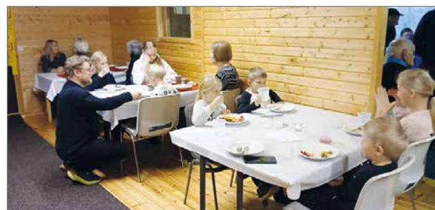
Hirvihallilla on tilaa useamassa huoneessa, joten kaikki mah- tuivat hyvin yhtä aikaa syömään.

Lisää juttua metsästyskaudesta ja eri seurojen peijaisista seuraavassa lehdessä.