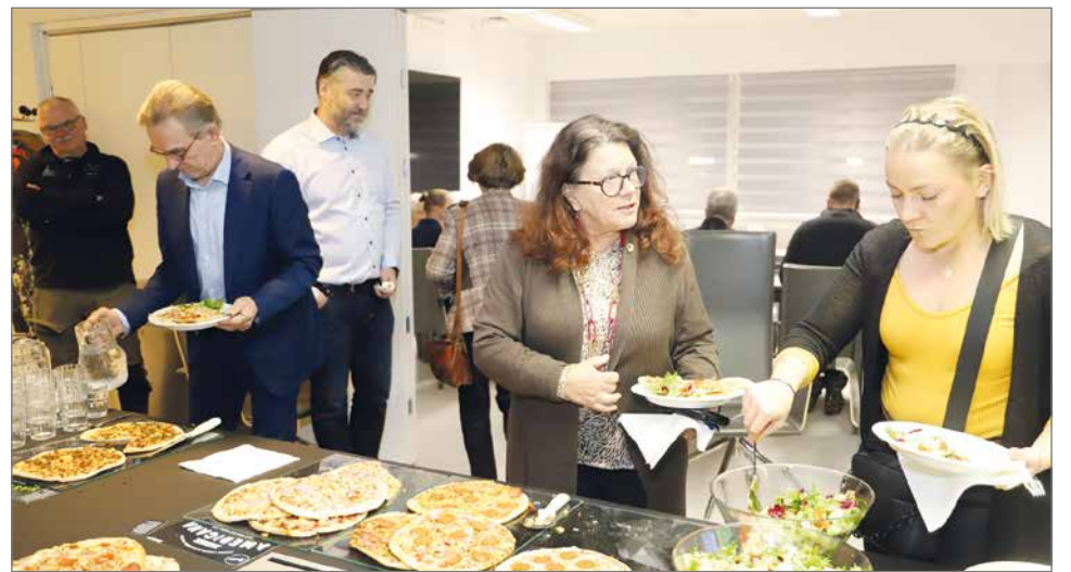
Aamukahveilla tarjottiin Apetitin eri tuotteista valmistettuja pizzoja.