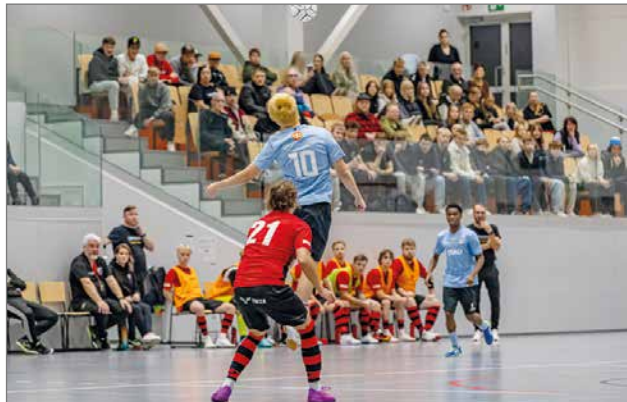
Tervakoskella runsas yleisö seurasi ottelua.