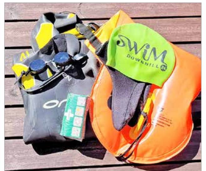
Varusteina oli märkäpuku, uimalakki, uimalasit, neopreenisukat, uimapouju, avaruuspeite, paineside, matkapuhelin ja pilli.