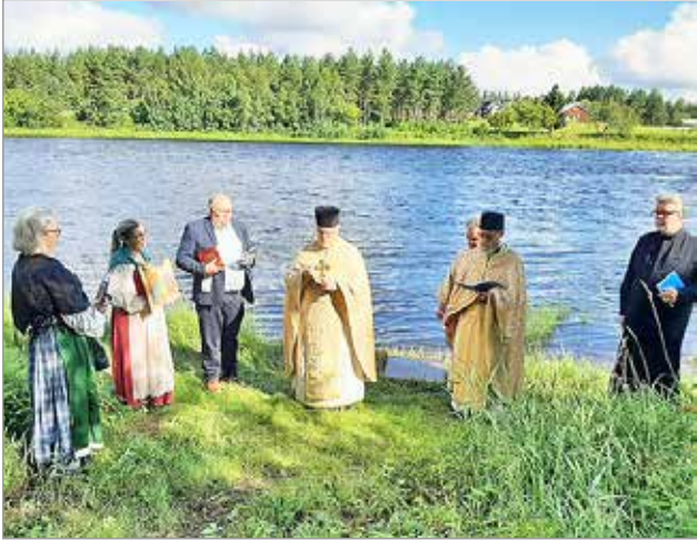
Vedenpyhitys tapahtuu lijoen rannassa. Kuva vuodelta 2023.

Omakotitalo/-tontti Pudasjärveltä, jossa autotalli tai mahdollisuus rakentaa. Mielellään 1990 luvusta uudempi. Huomioidaan vanhemmatkin, jotka ovat hyvällä tontilla tai vesistön vieressä. P. 040 414 8868.