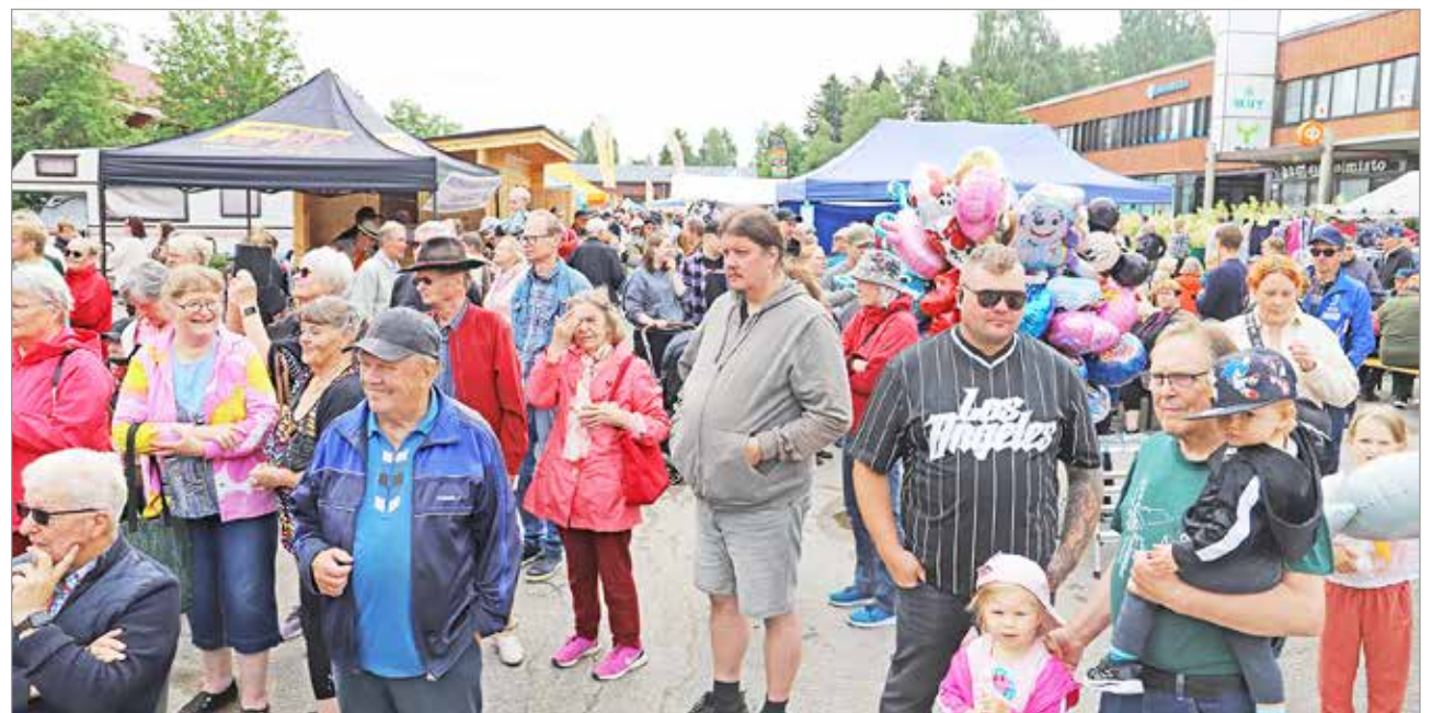
Lauantaina jo ennen puoltapäivää tori täyttyi markkinavieraista.