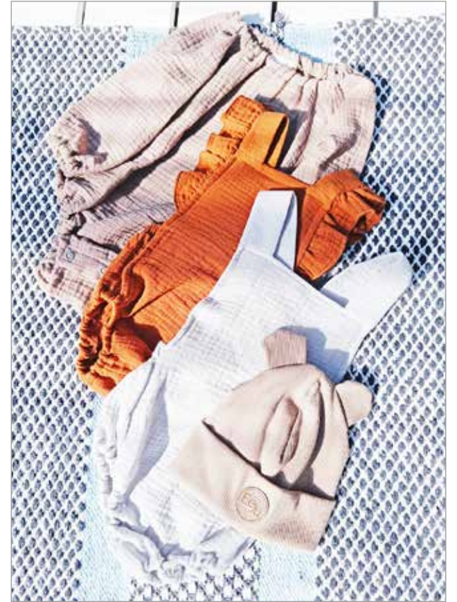
EeJu Designin nettikaupasta löytyy itsetehtyjä lastenvaatteita, asusteita ja vohvelipyyhkeitä.

Särkelälle on tärkeää, että materiaalit on tuotettu mahdollisimman lähellä ja esimerkiksi kaavalisenssit hän on hankkinut oululaiselta pienyrittäjältä. Jokainen kohtuullisen kokoinen jämpä säilötään tilkkulaatikoon ja hyödynnetään asusteiden, vaikkapa rusettien teossa.