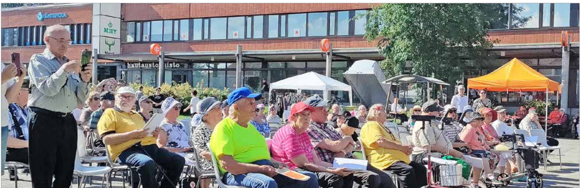
Helteestä huolimatta Suopunki-yhtye veti torille mukavasti porukkaa. Penkkejä piti hakea lisääkin!