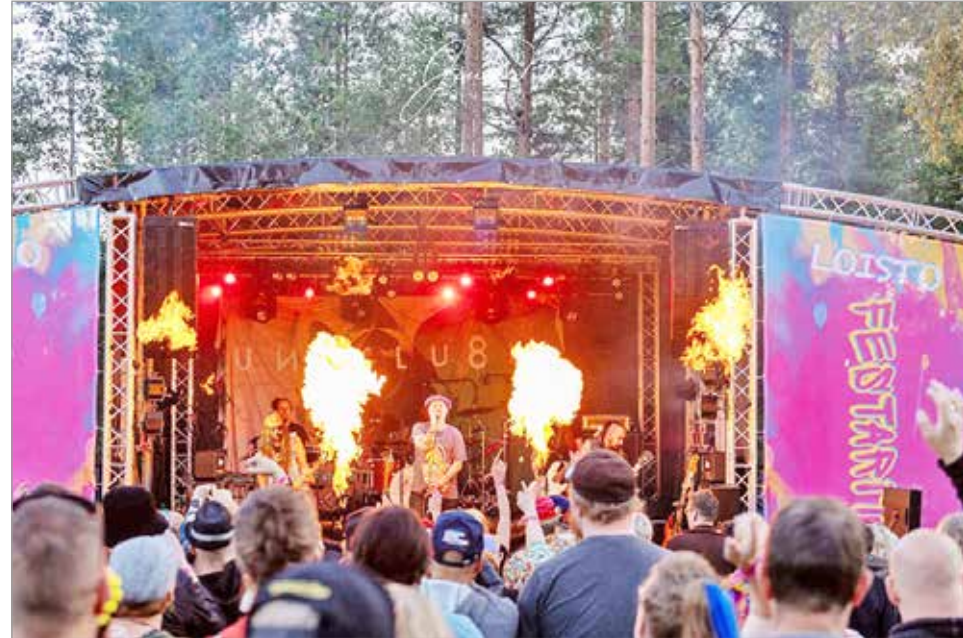
Uniklubi oli esiintymässä Loisto Festareilla elokuussa 2023.

Pienistä syntymäpäiväjuhlista alkunsa saanut ja jo taaperoikään kasvanut Loisto Festarit tuo tänäkin vuonna Pudasjärven tapahtumakesään oman omintakeisen lisänsä. Maalaisympäristössä, omatekoisella otteella rakennettu tapahtuma tarjoaa tyylilleen uskollisena taitavia musiikkiartisteja kunnon lavalta ja tasokkaalla äänentoistolla.