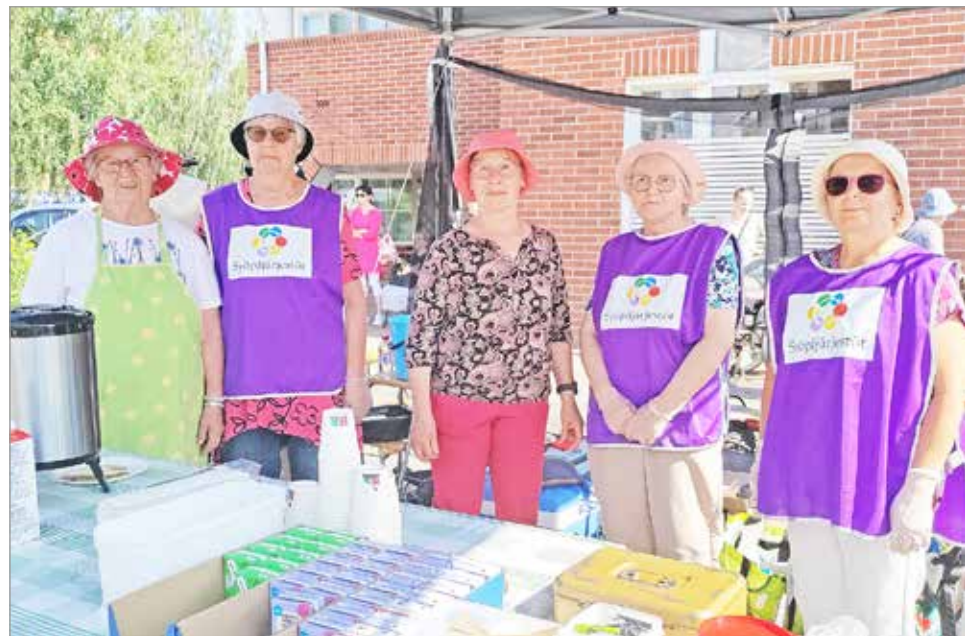
Kahvituksesta vastannut Syöpäkerhon porukka oli varannut neljä sankollista räiskäletaikinaa ja kaikki meni.