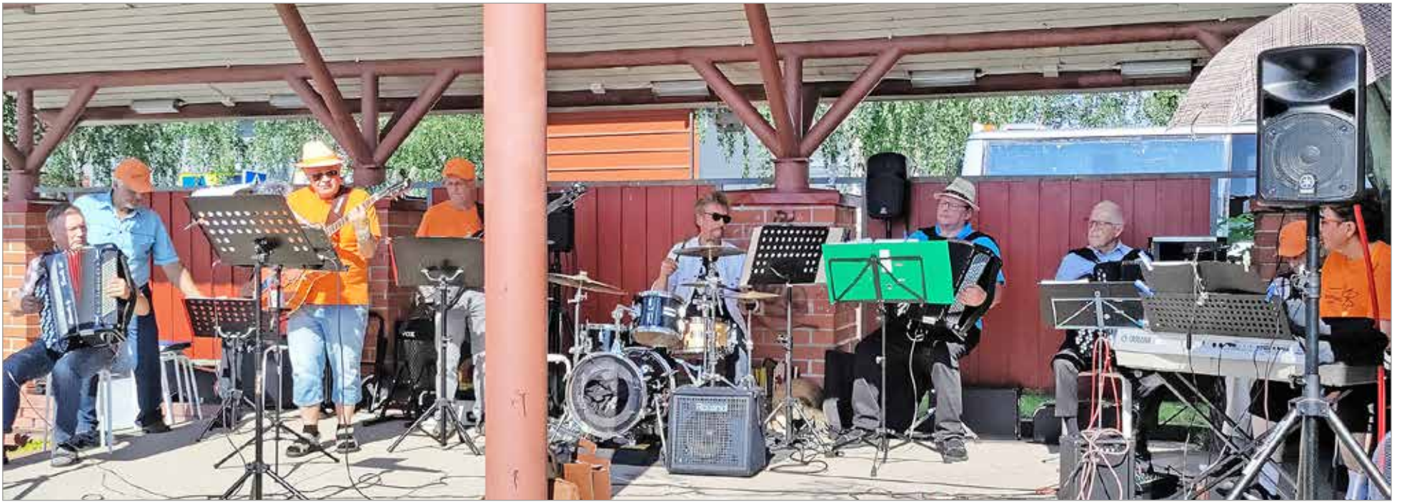
Ennen varsinaista yhteislauluhetkeä Suopunkiyhtye esitti kolme muistokappaletta vuoden aikana menehtyneille hanuristeille.