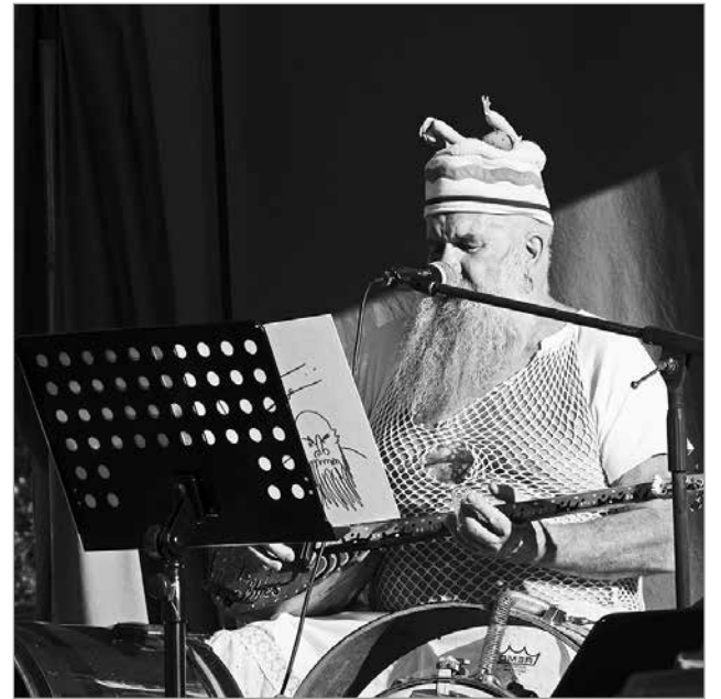
Illan isäntä lauloi ja soitti

Äänentoiston kanssa meinasi olla hiukan ongelmia, kun äänikeskus oli laitettu voimalinjan alle. Kunnialla kuitenkin selvittiin, kun ei ota huomioon muutamien ison kaupungin valittajia. Satapäinen yleisö kuitenkin tykkäsi, nauroi ja ihmettelivät erilaisia esityksiä, lauloihan alussa oikea tangolaulajakin ja burleskitytöt vetivät