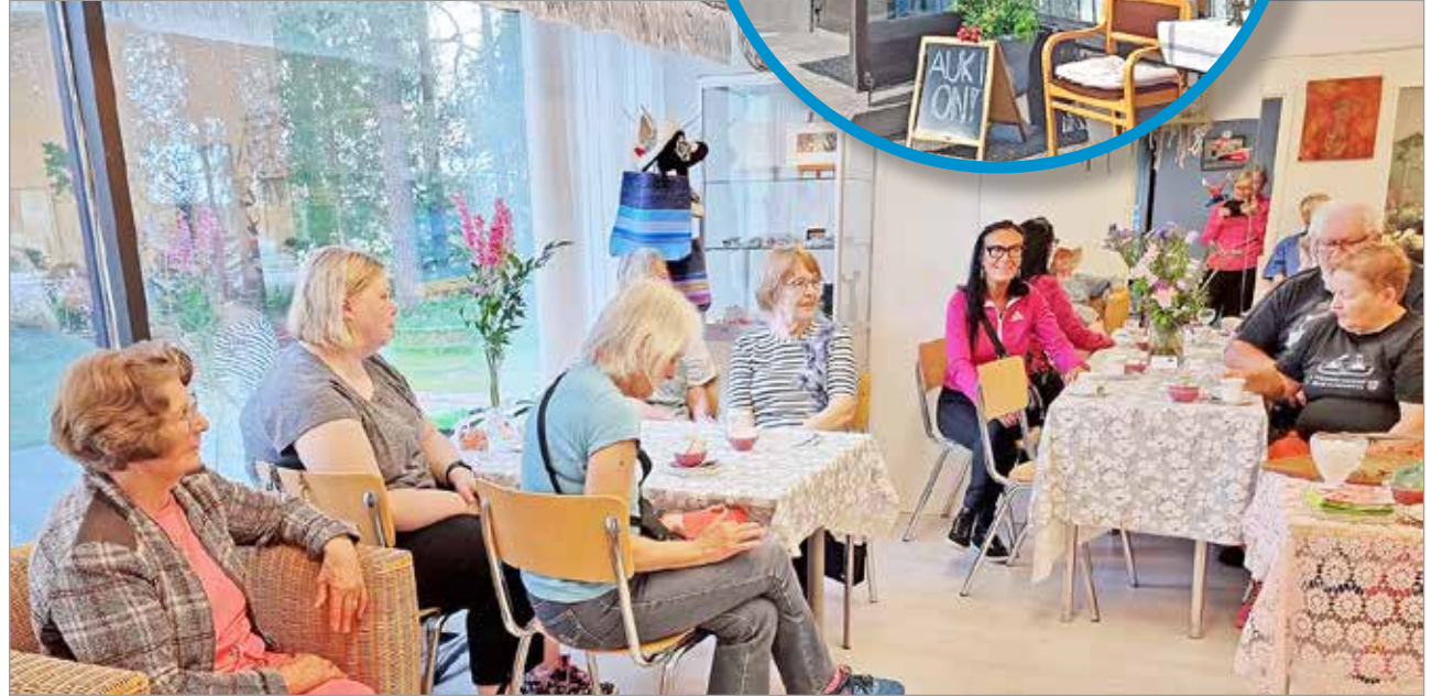
Ebban kulttuuripolun kävelijät ovat järjestäneet tänä kesänä kahvituksia Wirtaamossa. Kolmas kävely pidetään maanantaina 5.8., matkaan lähdetään S-Marketin pihalta kello 17. Kävelyn päätteeksi voi istahtaa kahville ja jutustelemaan Wirtaamon kulttuurikahvilaan.