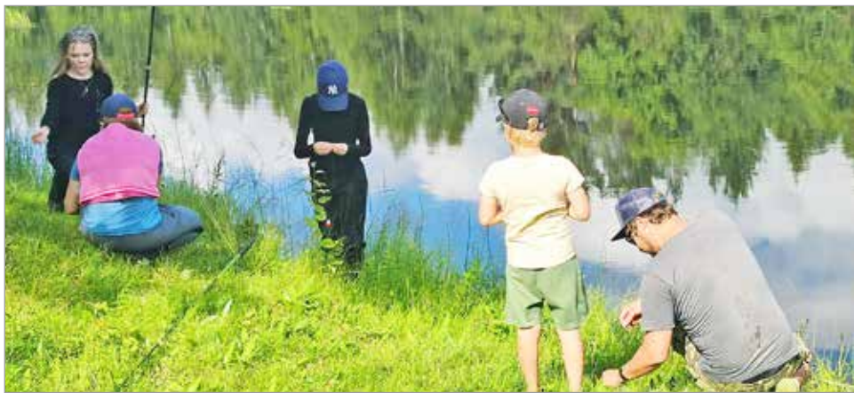
Lastensarjassa on lupa käyttää avustajia.