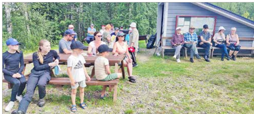
Lämpöinen kesälauantai houkutteli Siuruan Osakaskunnan laavulle väkeä pitkin pitäjää, naapuripitäjistä ja jopa ulkomailta lomareissulla olevia.