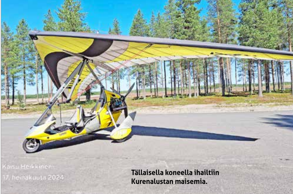
Kaisu Heikkinen 17. heinäkuuta 2024