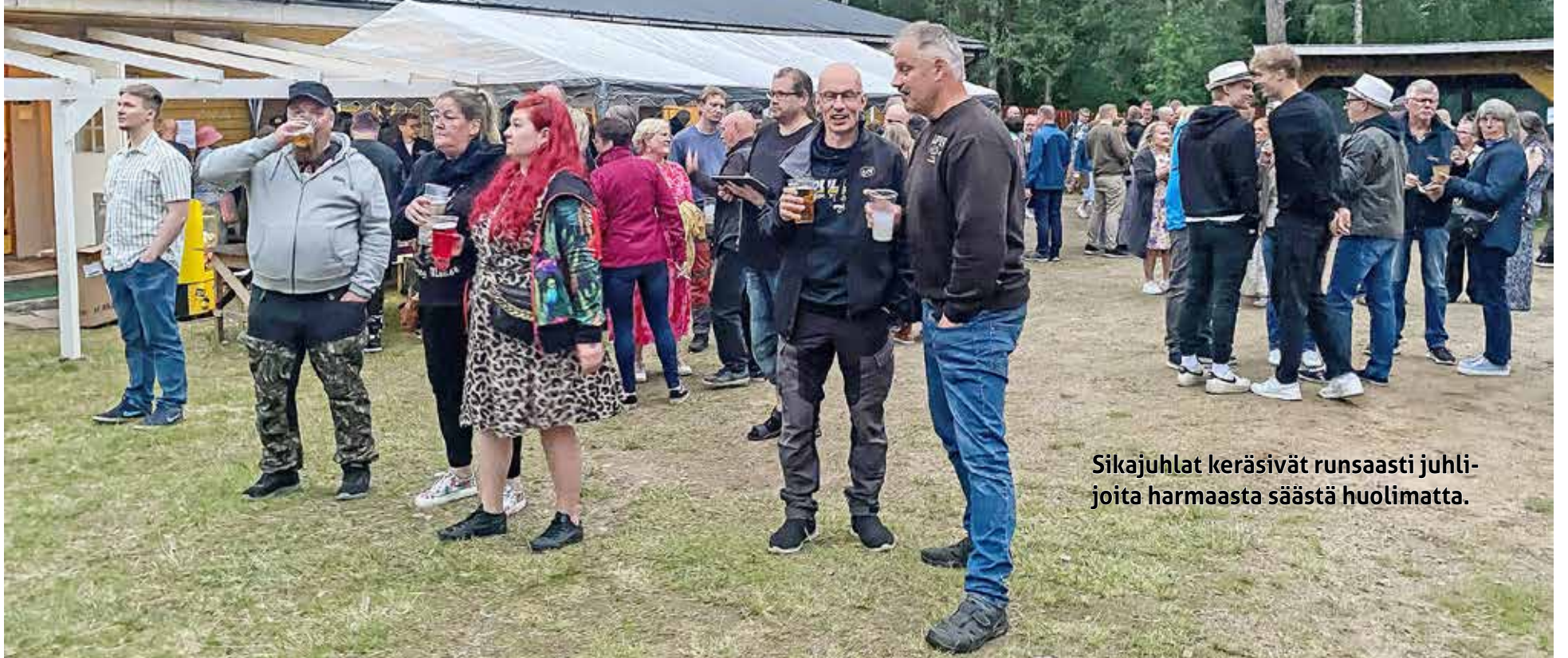
Sikajuhlat keräsivät runsaasti juhlijoita harmaasta säästä huolimatta.

Puhoskylän kyläseurantalolla Möykkälässä, järjestettiin perinteiset Sikajuhlat lauantaina 13. heinäkuuta. Harmaa sääkään ei synkistänyt juhlijoiden mieliä, sillä näissä kyläjuhlissa on vuosi toisensa jälkeen iloa ja kaikilla hyvä mieli.