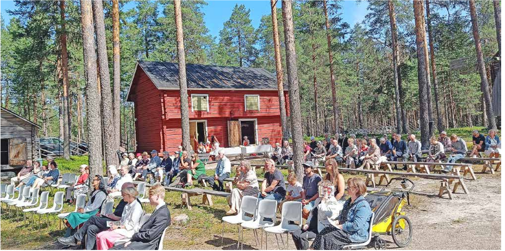
Kotiseutuviikon pääjuhlaa seurasi lähes satapäinen yleisö.