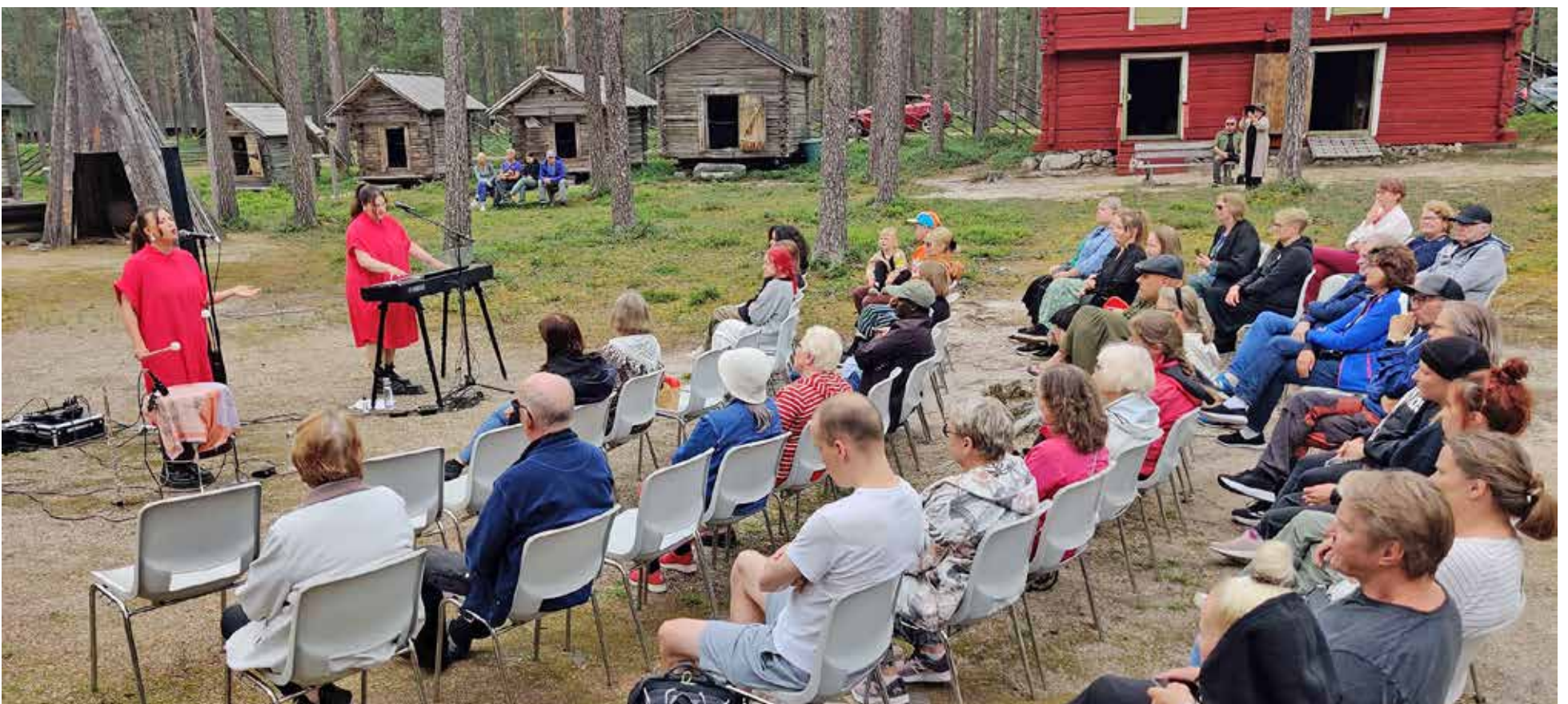
Peltokurki duon tunnelmallista esitystä seurasi noin 60 henkilöä.