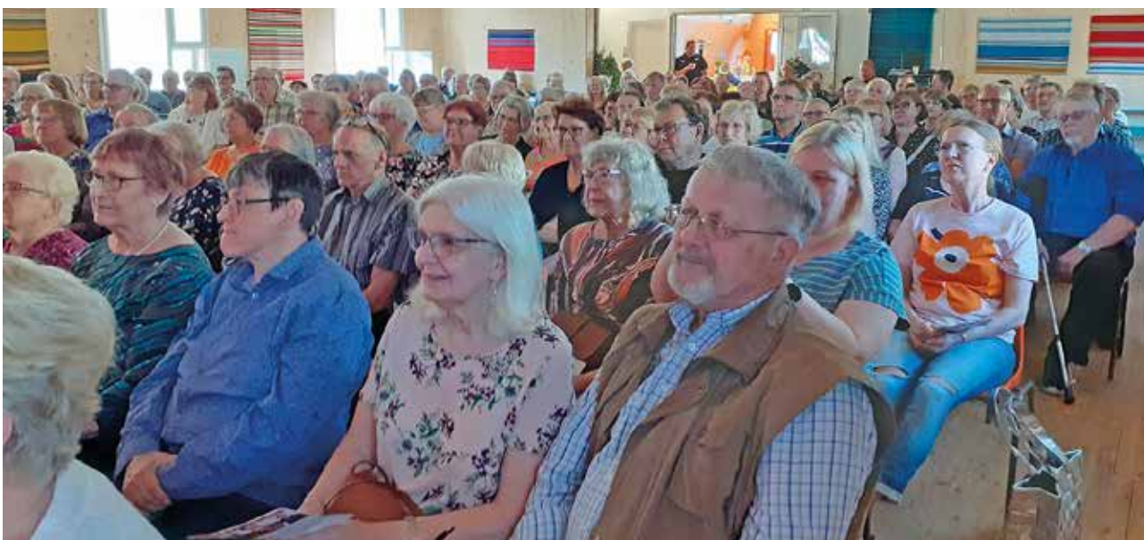
Musiikinäytelmää seurasi täysi salillinen - arviolta 250-300 henkilöä.