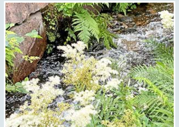
MAAILMA ON KAUNIS!

lukijoiden palaute ja jutut: vkkmedia@vkkmedia.fi