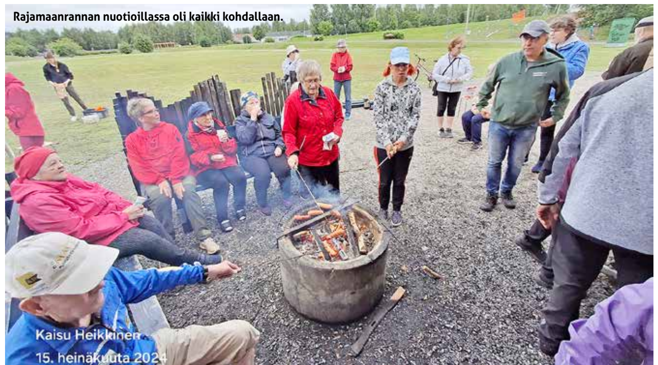
Rajamaanrannan nuotioillassa oli kaikki kohdallaan.