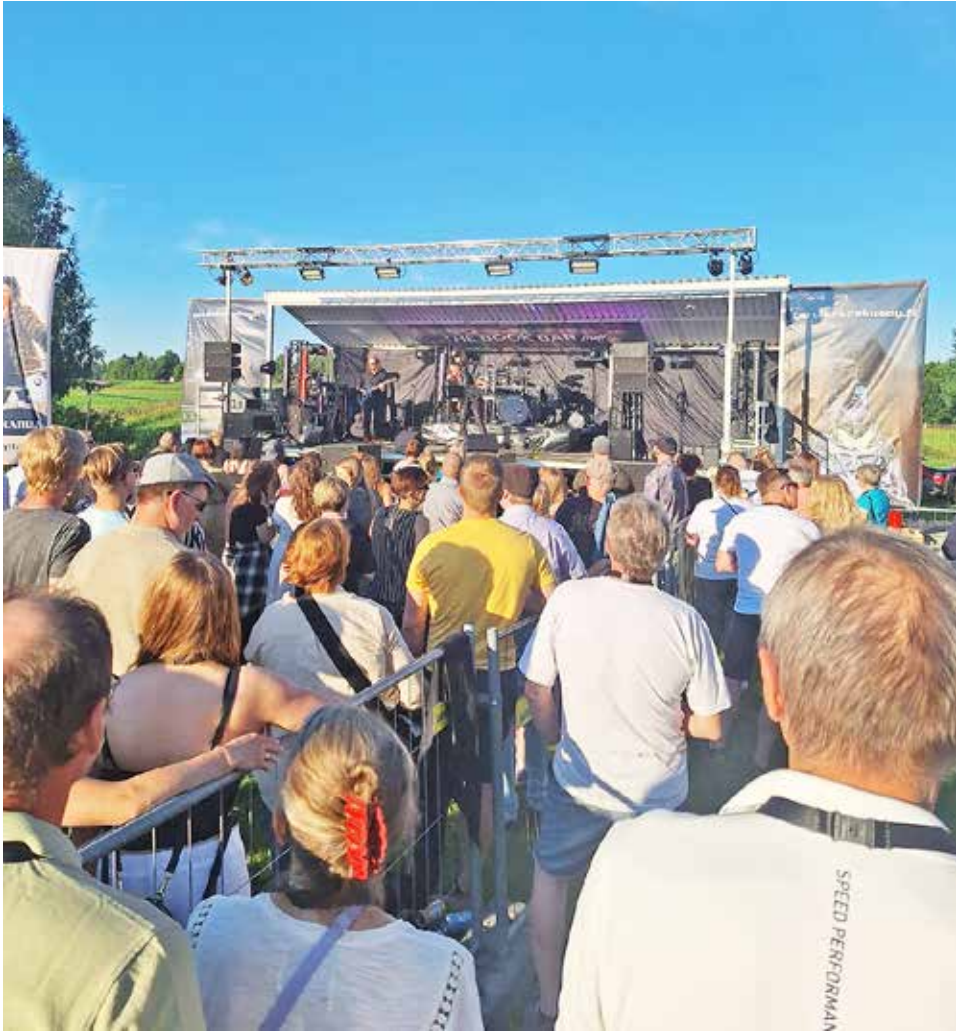
Uusi tapahtuma kiinnosti ranualaisia, mutta myös ulkopaikkakunnilta saapuvia festivaalivieraita.