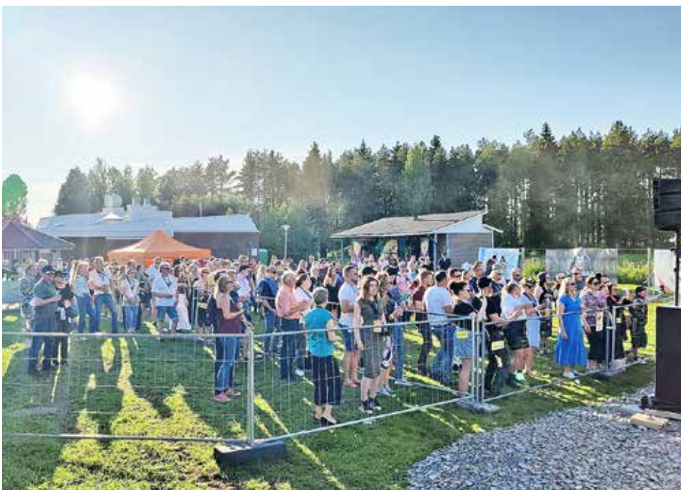
Iloiset festivaalivieraat nauttivat kauniista kesäillasta 20/7 järjestetyssä The Book Bar Pop'ssa Ranualla.