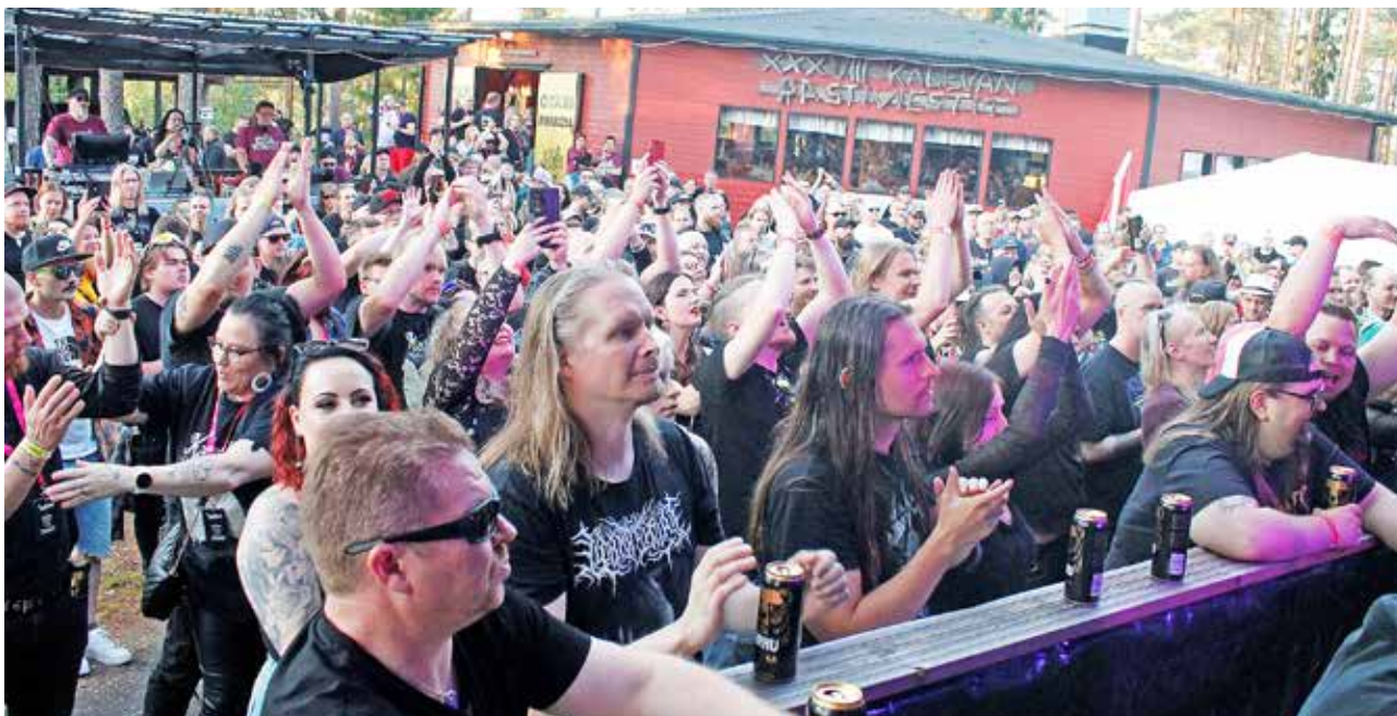
Festarialueelle saatiin sopivan tiivis tunnelma, vaikka tuhannen lipun tavoitteesta jäätinkin jälkeen.