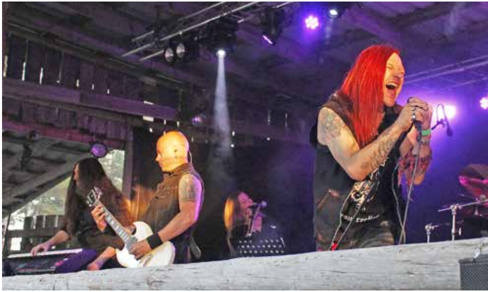
For my pain... hyppäsi lavalle tehden paluun noin 20 vuoden hiljaiselon jälkeen. Yleisöstä kuultua: "Voi veljet, tätä kannatti odottaa!"