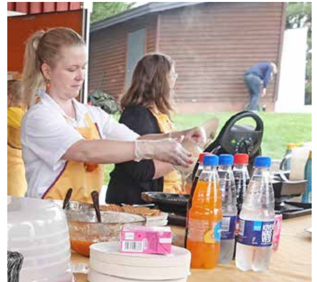
Ladyt torikeittiöllä.