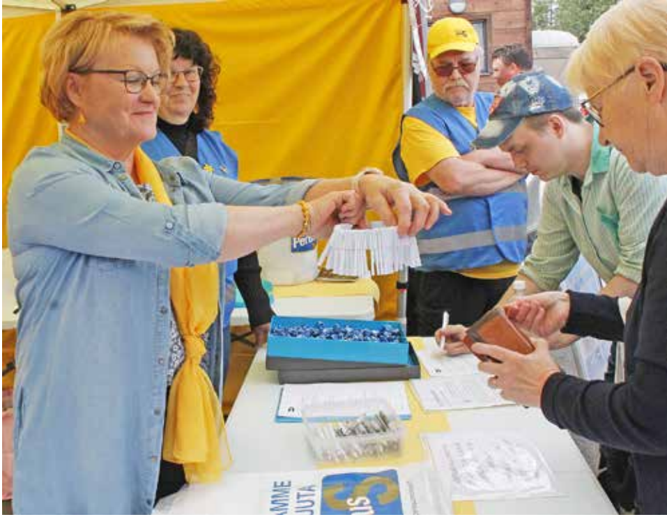
Tunnelmaa Perussuomalaisten teltalla Pudasjärven markkinoilla 6.7.