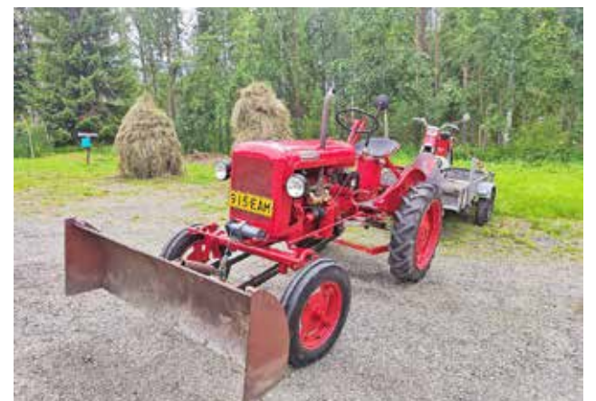
Traktoria tarvittiin ennen kuin heinät saatiin seipäille. Kautemmas päästiin liikkumaan muun muassa mopedilla.