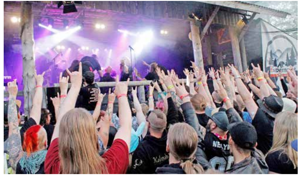
For my painin keikan päätteeksi yleisö osoitti suosiotaan bändiläisten Ypykkäselfelle.