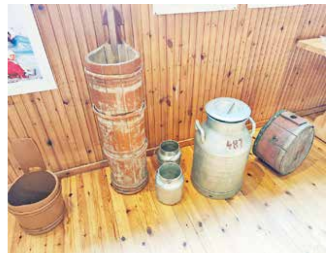
Maitotaloudessa käytettyjä tarve-esineitä.