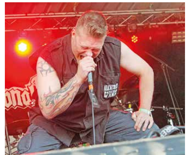
Ypykkä Metalfestin toisena aktina lauteille nousi National Napalm Syndicate.