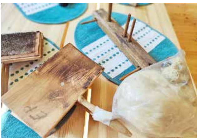
Ennen langaksi saattamista villan käsittelyssä tarvitaan muun muassa karstat ja rukki.