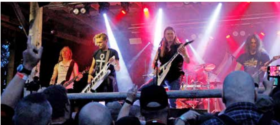
Kalmah viimeisteli Ypykkä Metalfestin annin. Muusikoilla riitti pilkettä silmäkulmassa ja energia hyökyi yleisöön, vaikka päivä oli ollut pitkä. Yleisö palkitsi soittajat hurmioituneella menolla ja hevimerkkien merellä.

- Meni neljä vuotta, että pudasjärvisien bändien aikataulut saatiin sopimaan yhteen. Olemme saaneet pelkästään hyvää palautetta, nyt voi olla helpottunut ja kiitollinen. JK