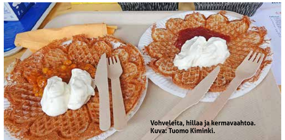
Vohveleita, hillaa ja kermavaahtoa.