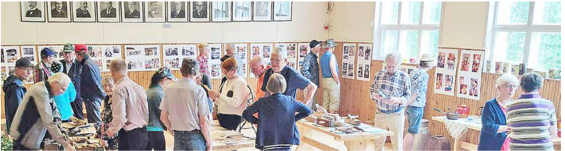
Vanhat esineet ja valokuvat kiinnostivat ja toivat muistoja mieleen vierailijoissa.