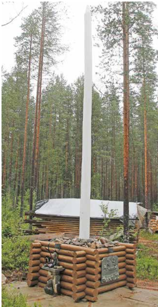
Pihapiirissä ylväänä kohoaa Outilan uusin taideteos Kollajan poola, joka kuvaa sekä alueen uittohistoriaa että saamelaisjuuria.

voi selvittää onko taiteilija paikalla, jos haluaa hänen esittelevän töitään. Galleriassa myös kirjamyyntiä. JK