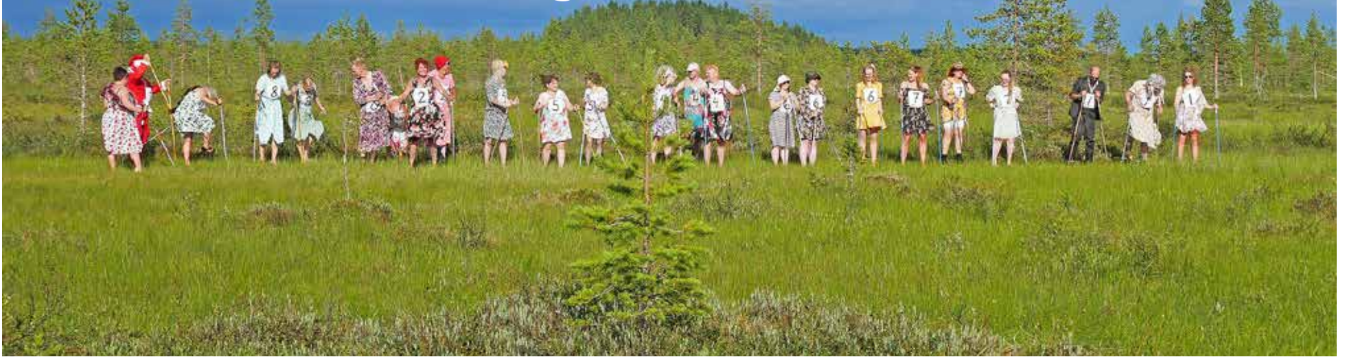
Kapustasuon männyn taimi ja kisailijat