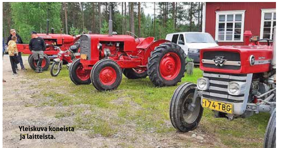
Yleiskuva koneista ja laitteista.