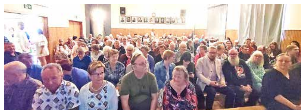
Siuruan Kylätalon sali oli ääriään myöten täynnä.