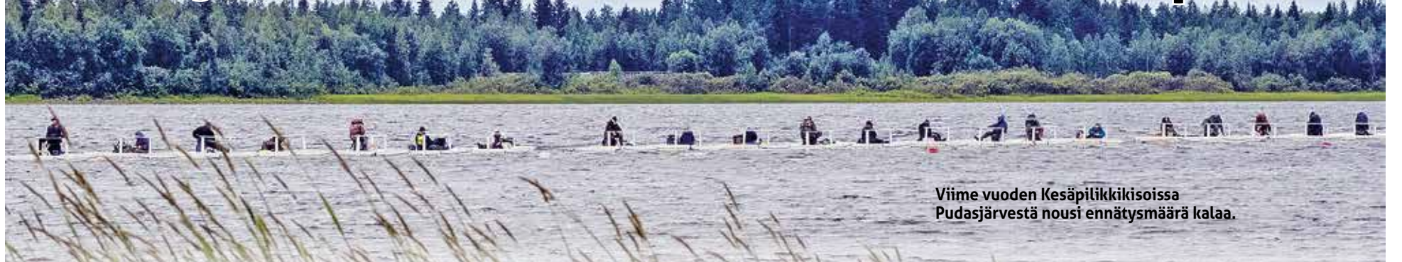
Viime vuoden Kesäpilikkikisoissa Pudasjärvestä nousi ennätysmäärä kalaa.

Kesäpilikin maailmanmestaruuskilpailut on yksi suuri Pudasjärven kesätapahtumista, joka toteutetaan tuttuun tapaan heinäkuun lopulla 23.-28.7. Kesäpilikki on järjestetty vuodesta 2004 alkaen ja kisapaikka sijaitsee Havulan rannassa, kotiseutumuseon läheisyydessä, kymmenisen kilometriä keskustasta.