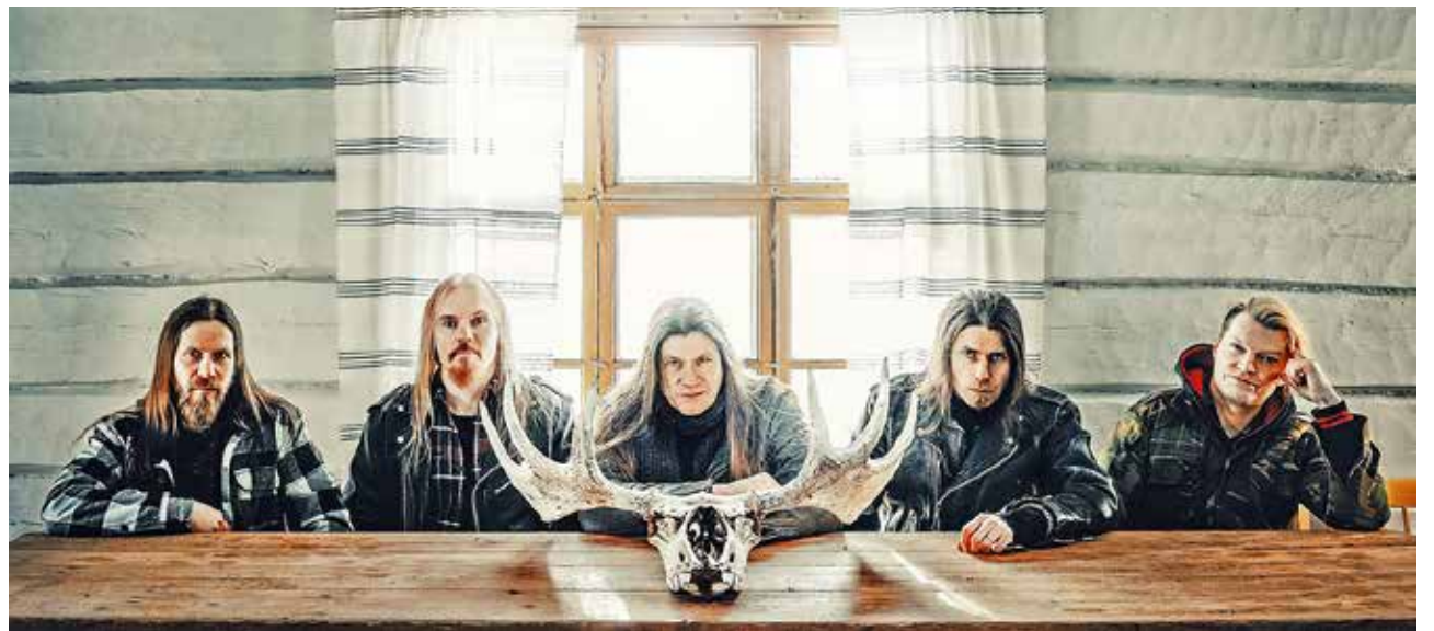
Ypykkä Metalfestin lavalle saadaan myös Kalmah-yhtye, jota ei tänä kesänä paljoa muilla lavoilla nähdäkään.