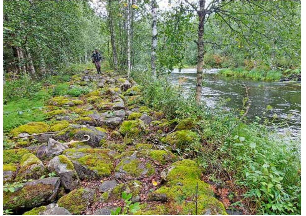
Koskesta perattuja kiviä penkereinä koskien varrella Livojoen yläosalla.