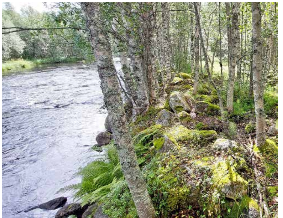
Ennen koskikunnostuksia uittoperkausten jälkeen penkereille kasvanut tiheä puusto poistetaan koneellisesti.