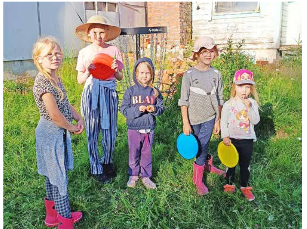
Uutena lajikoeluna heiteltiin frisbeekiekkoja koriin.