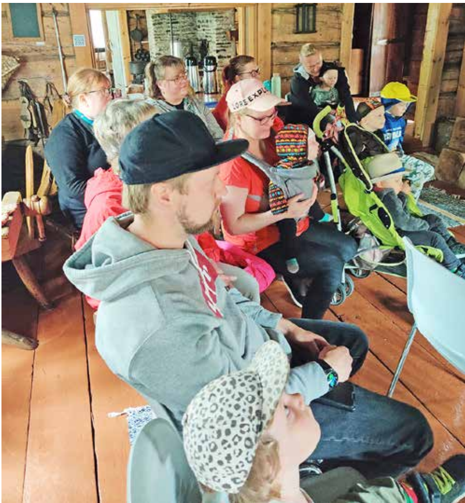
Liikkuvan Laulurepun konserttiin oli vapaa pääsy ja paikalle saapuikin sopivasti väkeä.