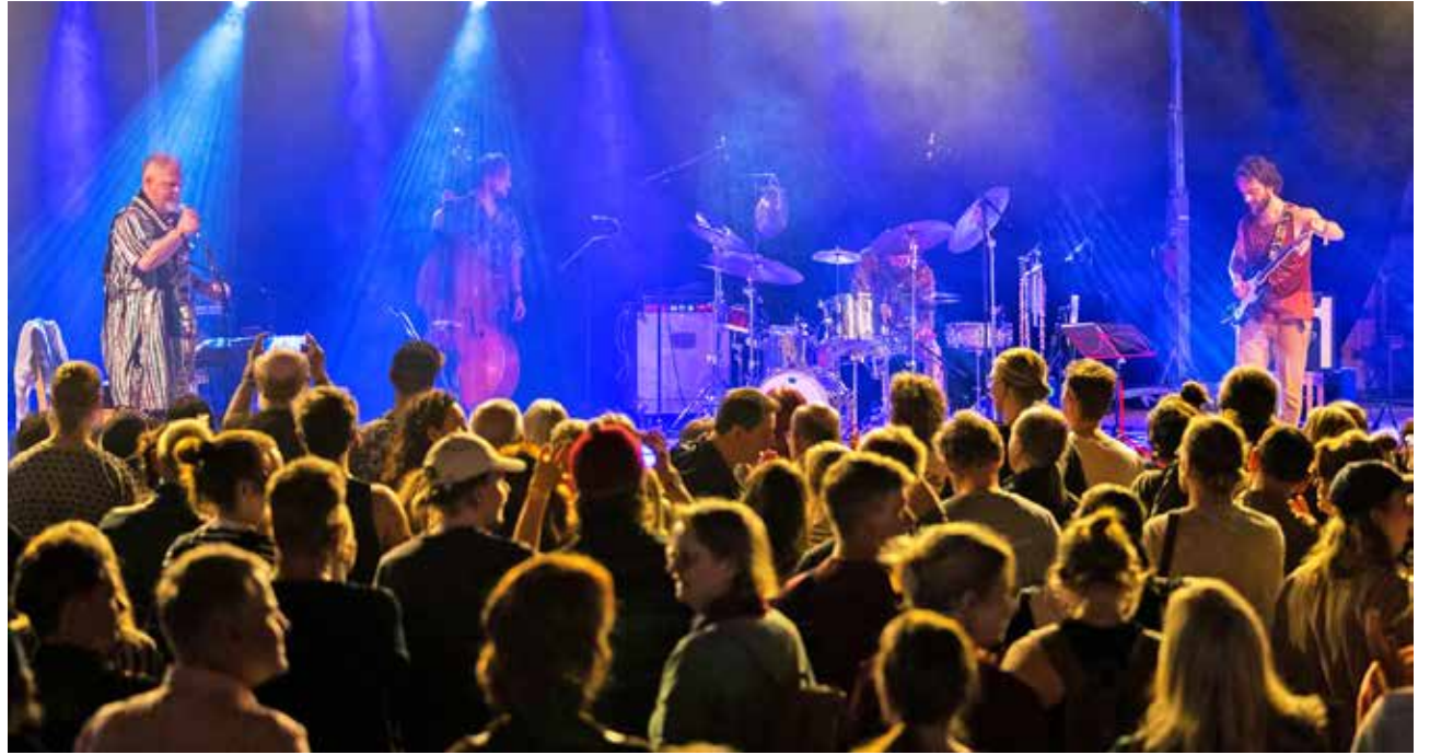
50-vuotista taivaltaan juhliva Piirpauke nähtiin myös Kaustinen kansanmusiikkijuhlien pääareenalla.