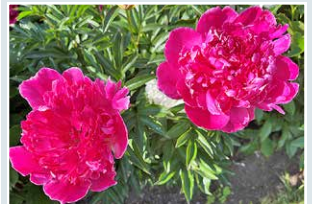
SUVEN SULOVÄREJÄ.

lukijoiden palaute ja jutut: vkkmedia@vkkmedia.fi