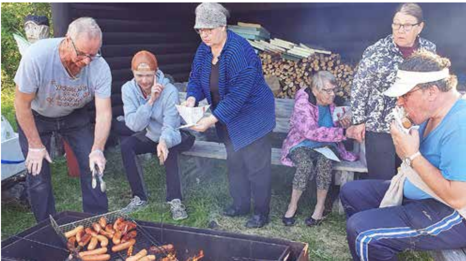
Nuotiomakkarokaroita paistettiin Kylätalon laavulla.