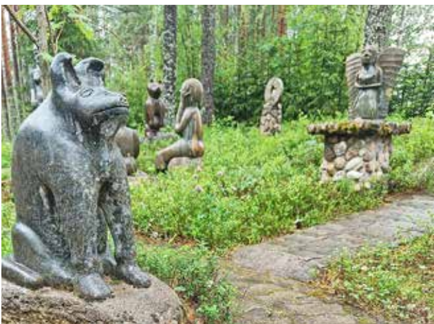
Gallerian pihapiirissä on ihastuttavia kiviveistoksia, joissa näkyy luonnosta, historiasta ja taiteilijan elämästä kumpuavat tarinat.