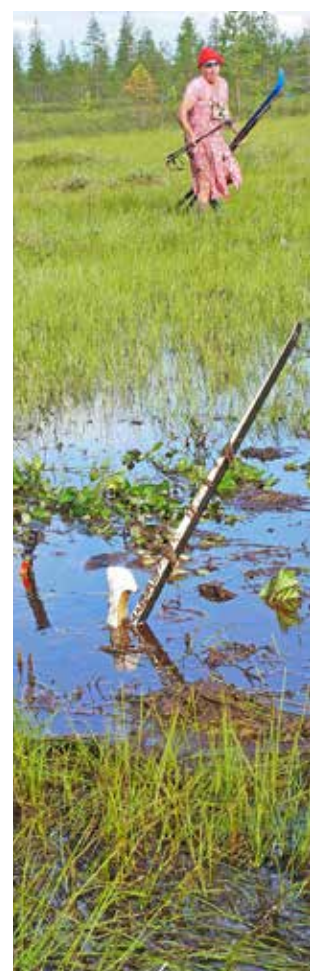
Kuka jäi suohon?