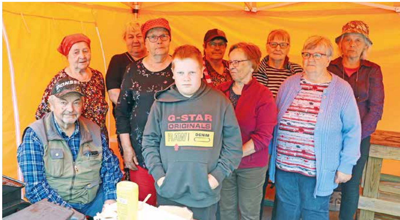
Torilla oli talkoilemassa kymmenkunta Sydänyhdistyksen aktiivijäsentä.

Jenny Kärki