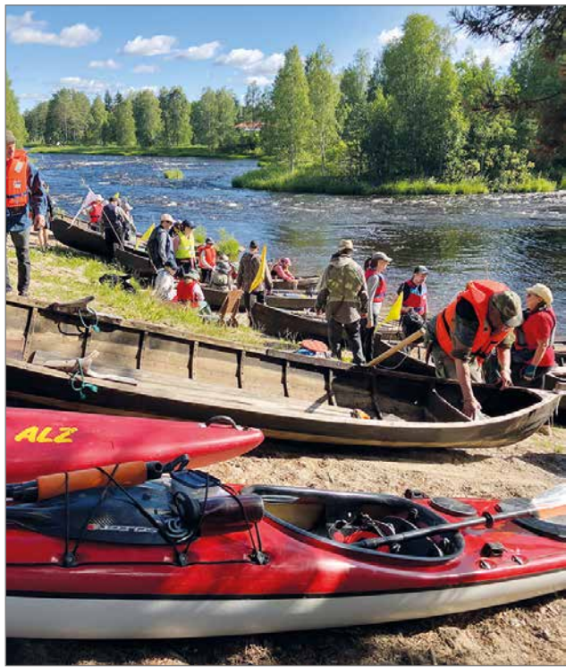
Jurmunlammen hiekkatörmällä vietetyn tauon jälkeen sou-tu jatkuu.