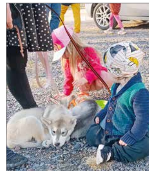
Ihanat koiravauvat mukana perheillassa.

Perheillan järjesti Perheen parhaaksi -projekti yhteistyössä Siuruan kyläry:n kanssa. Perheen parhaaksi -projekti "Uskoa, toivoa ja rakkautta" on ennaltaehkäisevää lapsiperhetyötä