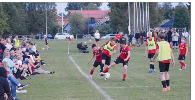
P14 pelasi yöttömän yön pelinsä klo 23 alkaen. Yöpeleissäkin oli paljon katsojia.

oli viime hetkille asti jännittävä. Upeita osumia tehtiin molempien joukkueiden toimesta. Viimeisillä minuuteilla ruotsalaiset osuivat useammin ja peli päättyi 6-3.