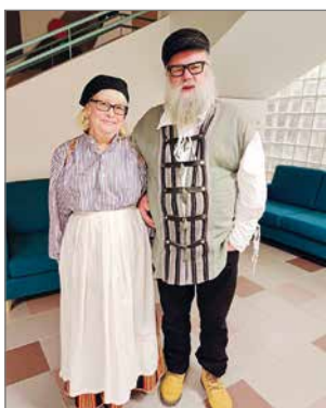
Myrskyluodon Maija -elokuvaan sonnustauduttiin 1800-luvun tyyliä mukailen.