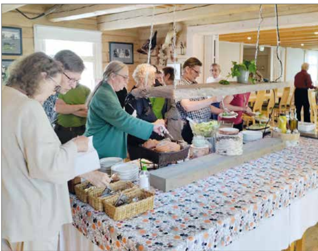
Lounaspöydässä oli tarjolla lohta kasvispedillä, perunamuusia ja vihersalaattia.