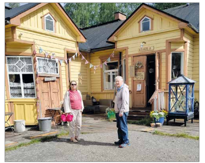
Taivalkosken keskustassa pysähdyttiin Jalavan pirttikahvilaan.