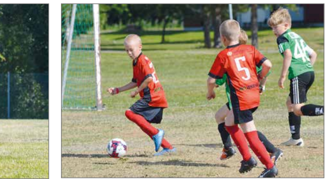
Kurenpoikien pelaajat kannustivat omiaan ja kannoivat seuran lippua ylpeydellä.

telu IFK Råneå:ta vastaan. P14 lähti alkulohkon viimeiseen peliin taistelemaan jatkoaikasta Skellefteå FF:ää vastaan. Niukka 2-1 tappio vahvaa ruotsalaisjoukkuetta vastaan tiesi sitä, että jatkopelejä jäivät haaveeksi. P11 sijoittui lohkostaan toiseksi, kun Gammelstads IF Vit voitti lohkoiton ratkaisseen pelin 2-1. Iltapäivällä koko seuran väki lähti kannustamaan P9 joukkuetta Furunäsettiin. Vahvan tuen saattelemana nuorimmat Kurenpojat antoivat kaikkensa ja olivat pelissään ylivoimaisia. Ruokataulun jälkeen koko osasto lähti vuorostaan tukemaan P11 joukkuetta ensimmäiseen jatkopeleinsä. Maalirikas peli Storfors AIK:ta vastaan