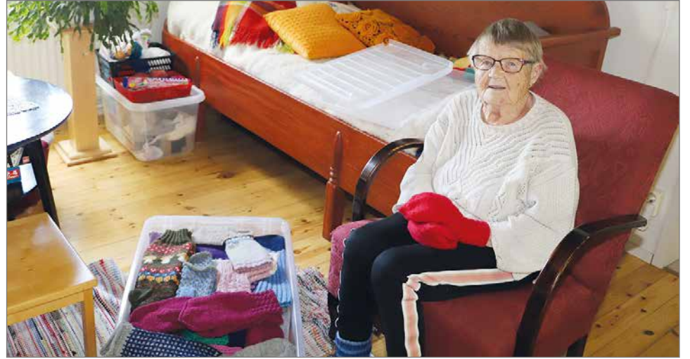
Käsityöt ovat Astan lempi puuhaa. Kudottuja sukkia ja lapsia on useamman vuoden tarpeeseen.

Arjen helpottamiseksi nykyään posti tuodaan pihalle asti. Kauppa-asiolla he käyvät vävyn kanssa Kurenalla tai vävy käy Ranualla - kumpaankin paikkaan on yhtä pitkä matka. Ruu-