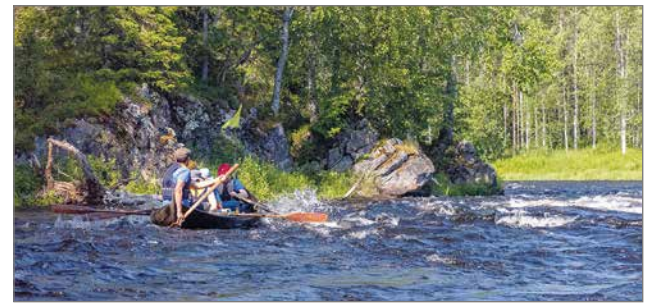
Runsas vesimäärä Ijoessa ja osaavat perämiehet jouduttivat Ijokisoutua®.

Saara Airaksinen, kuvat Sally Luhta ja Saara Airaksinen