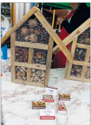
Markkinateltalla oli myynnissä myös hyönteishotelleita sekä kyläyhdistyksen liittyvillä kuvilla koristeltuja tulitikkusaukkoja.

Pudasjärven markkinat järjestettiin 5.-6.7. ja perinteiseen tapaan mukana oli myös Siuruan kylä ry, jonka kahvioteltalla kävi melkoinen kuhina koko lauantain. Sateisesta perjantaista huolimatta kyläyhdistyksen väki oli enemmän kuin tyytyväistä, kun lauantaina väkeä kävi hyvin ahkerasti kahvittelemassa ja porisemassa.