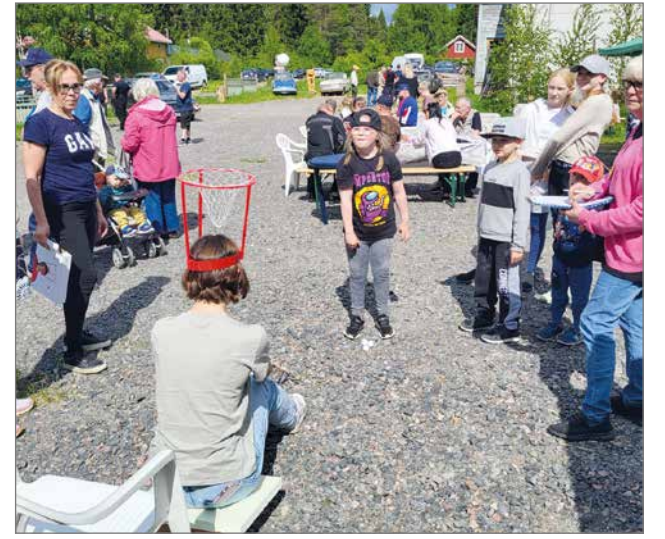
Lapset pääsivät kokeilemaan uutta pääkoris peliä.

Miinaharava antoikin heikon signaalin. Kaivoim-