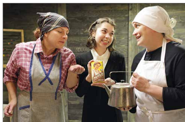
Näytelmän henkilöt ovat fiktiivisiä, mutta aihe perustuu laajaan kirjalliseen materiaaliin ja aikalaishaastatteluihin.

Suomussalmen kesäteatterin näytelmä, Toivon vuosi, kertoo pienen kyläyhteisön kautta tästä maamme kehitysvaiheesta. Toivon vuosi kertoo sodanjälkeisten aikojen tarinaa etupäässä lasten näkökulmasta. Eletään vuotta 1948. Kymmenvuotias Toivo poika rakentaa äi-