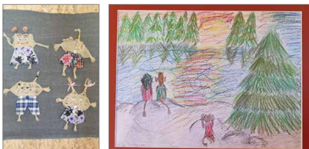
Lapsien näkemyksiä peikkometsästä.