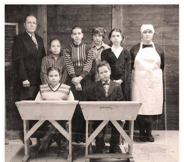
Vaikka kuvattu aikakausi on köyhä ja karu siinä on myös tulevaisuuden toivoa paremmasta.

Näytelmän käsikirjoittajat Eero ja Ulla Schroderus kertoivat, että näytelmän henkilöt ovat fiktiivisiä, mutta aihe perustuu laajaan kirjalliseen materiaaliin ja aikalaishaastatteluihin. Vaikka kuvattu aikakausi on köyhä ja karu siinä on myös tulevaisuuden toivoa paremmasta. Toivon