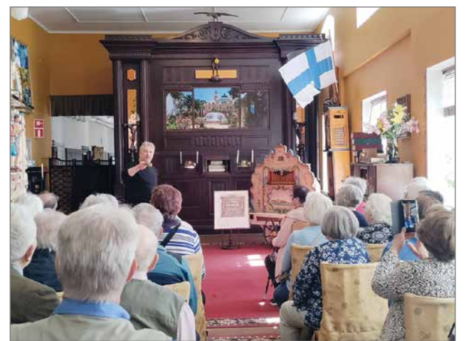
Konserttitietä maailman tiettävästi ainoan 75 soittajan or- kestrionin Goliathin eli Goljatin äärellä.

Torstaisen paluumatkan en- simmäinen käyntikohde oli Taidekeskus Väinölä Varkau- deussa. Kun saavuimme pihapiiriin, vastassa oli ai- van ihastuttava talo pihapii- reineen. Paikan omistaja ja myös portaille asetettu pose- tiivi miellyttävällä soitollaan toivottivat meidät tervetul- leiksi Iloa - Naivistit näyt-