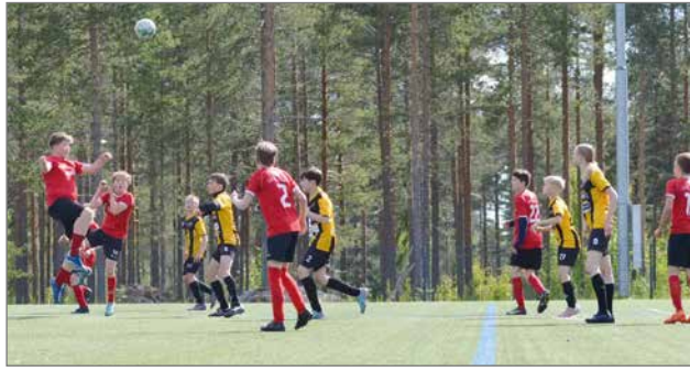
P14 joukkueen erikoistilannepelaaminen oli tehokasta kevätkierroksen viimeisissä peleissä.

Kevätkierroksen viimeinen ottelu pelattiin lauantaina 15.6 Jäälissä LaFK-KKP/Keltaisen vieraana. Ottelusta muodostui maali-iloittelu. Heti ensimmäisellä peliminuutilla nähtiin maali, kun