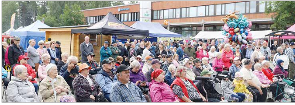
Lauantaina jo ennen puoltapäivää tori täyttyi markkinavieraista.