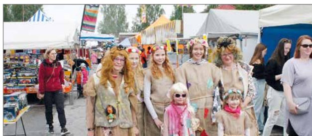
Siurualaiset olivat esillä myös markkinaohjelmistossa, sillä Siuruan peikot esiintyivät Tykylevitsin musiikkinumeroissa tanssijoina.

- Nyt on ollut aivan mainiota menoa! Lisäksi olemme saaneet paljon kehuja siitä, että kojumme valikoimassa oli otettu myös erikoisruokavaliot huomioon. Toisinaan markkinoilta voi olla vaikeakin löytää gluteenitonta tarjontaa. Kyllä kaikki asiakkaat