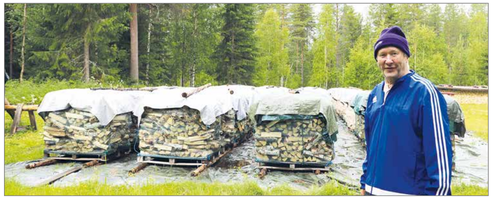
Pirtin uunissa poltettavista puista Juho tekee siistit, tukevat pinot.

Juho pitää tärkeänä kunnan ylläpitämisessä liikkuamisen merkityksen. Hän kokee saavansa riittävän liikunnan hyödyn hyötyliikunnan kautta. Juho on huomannut että, "roppa" vaatii nykyään raskaasta ruumiillisesta työstä palautumiseen