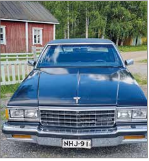
Yksi näytillä olevista autoista.