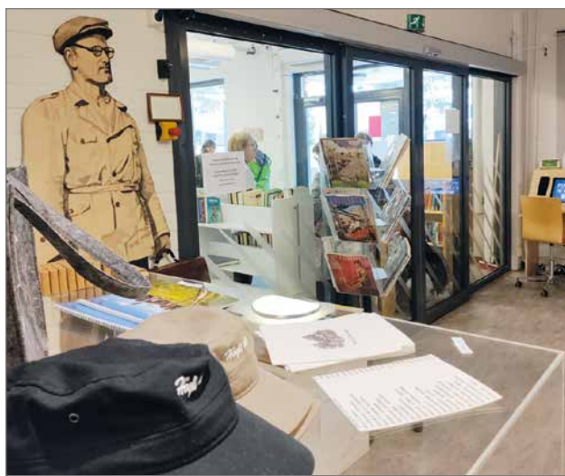
Päätalo keskuksessa tutustuttiin näyttelyihin.