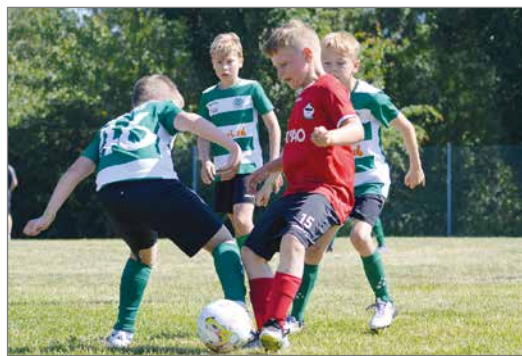
P11 eteni omasta lohkostaan jatkopeleihin.