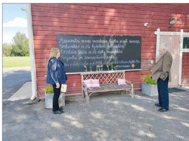
Tertin kartanon mieteläuselman äärellä.