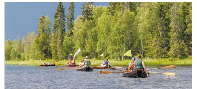
Suvannot tarjosivat hyviä tilaisuuksia lapsille opetella soutamaan perinteistä jokivenettä.