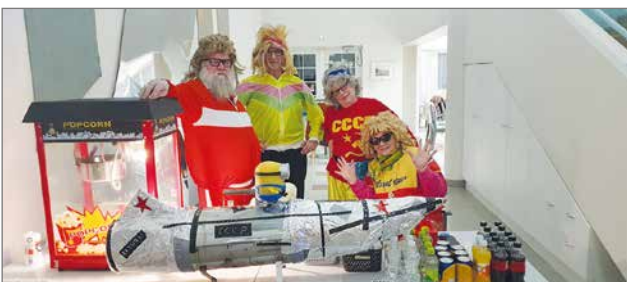
Ohjus-elokuva perustuu 1980-luvun ohjusselkkaukseen, joten elokuvaherkut sai ostaa kasan muoti-ikoneilta.