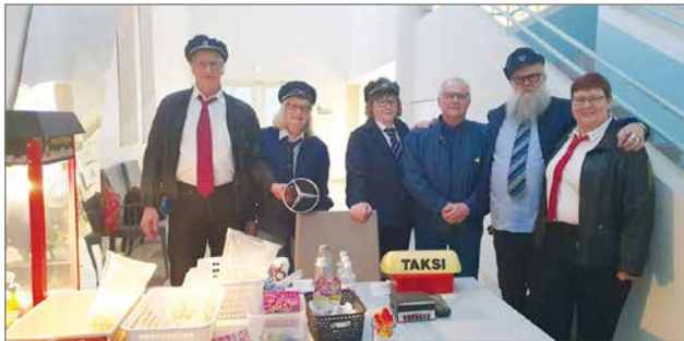
Kylä isä osaa -elokuvan popcorninmyyjillä oli taksirekvisiittaa.