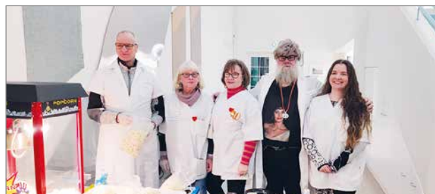
Syke-elokuvan teeman mukaisesti sairaala-asuissa.