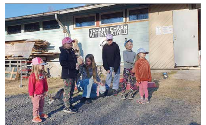
Lapsia osallistumassa Siuruan perheiltään.