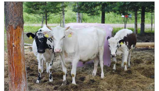
Pari hiehoa ja sonni käyskentelivät omassa aitauksessaan ja pysähtyivät tuijottamaan vieraita.