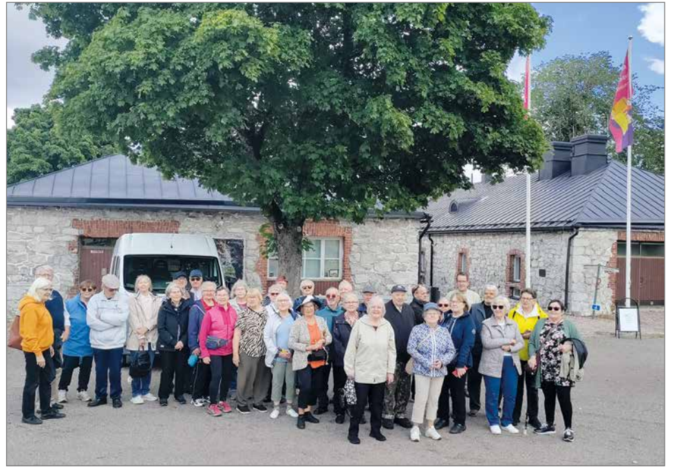
Retkeläiset Etelä-Karjalan museon edustalla.