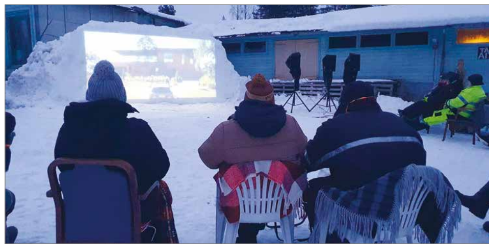
Siuruulla saatiin kevättalvella katsoa Luottomies-elokuva lumiselta valkokankaalta.