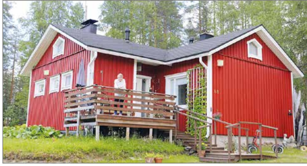
Asta Kaveri on asunut nykyisellä paikalla noin 90 vuotta.

Astan aika kuluu talvisin hoitamalla neljää poroa ja kahta kanaa. Päivänaskareisiin kuuluu kanojen karsinan siivous, jyvien anta-