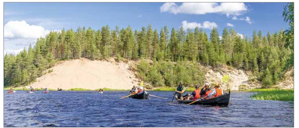
Sunnuntaiamuna Ijokisoutu® valmistautuu toiseen soutupäivään Taivalkosken Tynnyrimutkassa.

Keskustelua käytiin ELY-keskuksen kalaviranomaisen kanssa Ijoen istutusvelvoitteen muutoshakemuksesta kalatievelvoitteeksi. Päätöstä Aluehallintovirastosta on odotettu jo lähes seitsemän