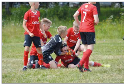
P12-joukkueen turnaus päättyi riemukkaasti voittoon tappioasemasta nousun jälkeen.

Ensimmäinen turnauspäivä alkoi vauhdikkaasti. Kolmella joukkueella pelit alkoivat perjantaina jo heti aamukahdeksalta eri puolilla Piteån pelikenttiä. P14 joukkue avasi turnauksensa vakuuttavalla 3-0 voitolla norjalaisesta Morkved SK:sta. Majapaikan lähikentällä P12 joutui toteamaan Gronnasen IL:n paremmakseen lukemin 1-5. Nuorin Kurenpoikien joukkue P9