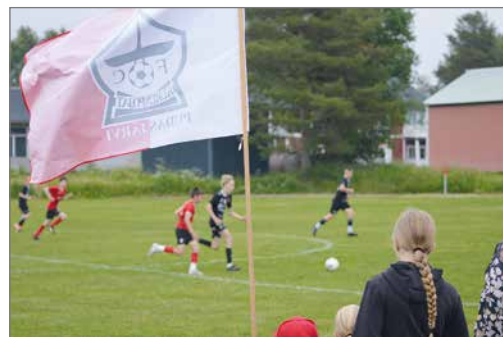
Pienimpien joukkueen pelaajat olivat hyvällä maalintekopäällä.

Kurenpoikien joukkueiden osalta P14 joukkueen yöttömän yön peliin. Nuorimmat joukkueet jäivät majapaikkaan yöpuulle, kun vanhin ikäluokka matkasi kävellen kello 23 alkavaan peliinsä lähikentälle. Yöpele paikallista FC Norrskenia vastaan oli vauhdikas, jännittävä ja tasainen. Kurenpoikien lento oli vahvaa ja erinomaisella esityksellä joukkue pääsi juhlimaan 3-0 voittoa pitkän pelipäivänsä päätteeksi.