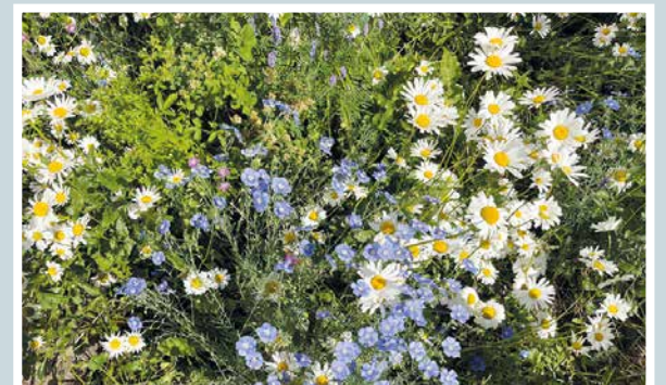
Niittykukkia poimin vain sulle!

Martti Kähkönen lukijoiden palaute ja jutut: vkkmedia.fi