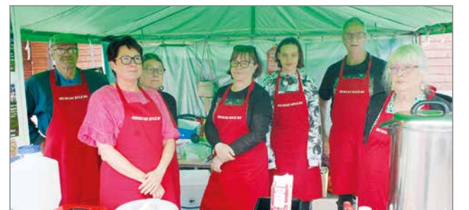
Siurualaisen palvelualltius huomattiin Pudasjärven markkinoilla, sillä hymyjä nähtiin tiskin molemmin puolin.

Siuruan kylä ry on tullutkin tunnetuksi öökkähottelien rakentamisesta sekä