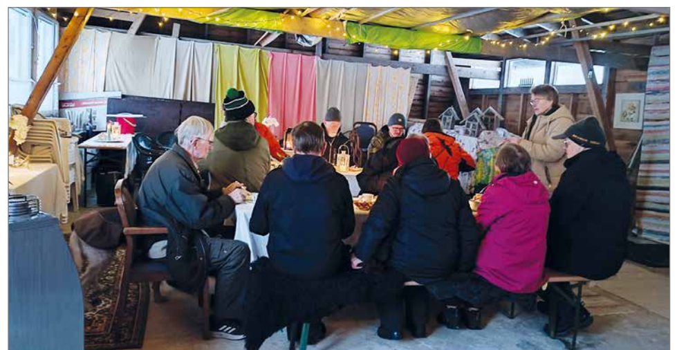
Syntymäpäivävieraita eri puolilta Suomea.

Tarkoituksena oli järjestää sellaiset paremmin vaatimattomat ja rennot juhlat. Juhlat olivatkin rennot, mutta kyläyhdistyksen järjestelyt ylittivät kaikki odotukset. Juhlien eteen oli tehty paljon töitä. Vieraita, 5-91 vuotiaat ja yksi koira Helsingistä Ivaloon, todella viihtyivät juhlissa sisällä ja ulkona tulilla. Jälkikäteen sain vies-