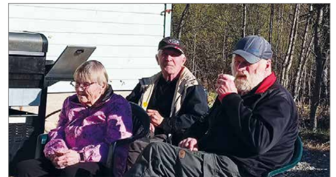
Perheiltään osallistui myös varttuneempaa väkeä.

yhteistyössä lasten ja perheiden parissa työtä tekevien tahojen kanssa. Projektin koordinoijana toimii seurakunta.