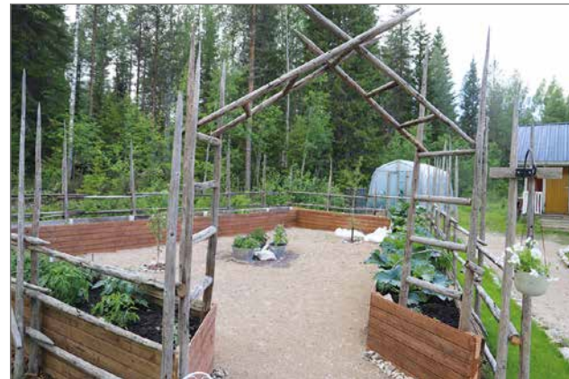
Juuri valmistunut omaperäinen puutarha on tehty siten, että siinä voi käyskennellä.