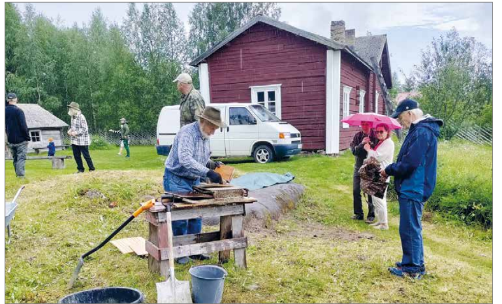
Kallioniemen pihalla oli meneillään tiilentekonäytös. Kaksi miestä teki tiiliä perinteisellä menetelmällä.

Paluumatkalla arvottiin arpapalkinnot, päävoittona oli herkkukori. Vanhat tavarat niin Kallioniemen kotimuseossa kuin Jalavan kaupassa innoittivat matkailaisia muistelemaan entisai-