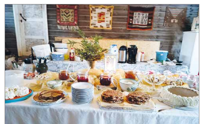
Pöytä on katettu erilaisilla herkuilla.

tejä, kuten "kiitos mahtavista juhlista", "hienot juhlat". Voin lämpimästi suosii-