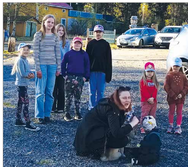
Koiravauvat huomion keskipisteenä.

Mukavan leppoisen perhetapahtuma illasta kiittäen Siuruan kyläyhdistys.