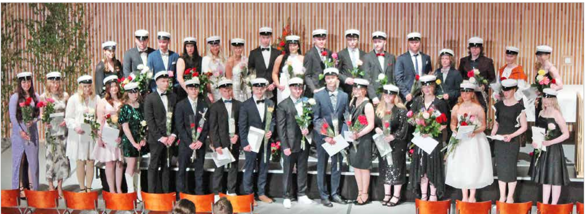
Iin lukion uudet ylioppilaat keväällä 2024.