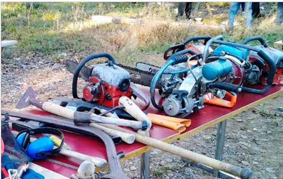
Metsätyönäyttely v. 2013 Yli-Olhava MMS.

Heikki Lahdenperä osa haastatteluista Eero Alaraasakka.