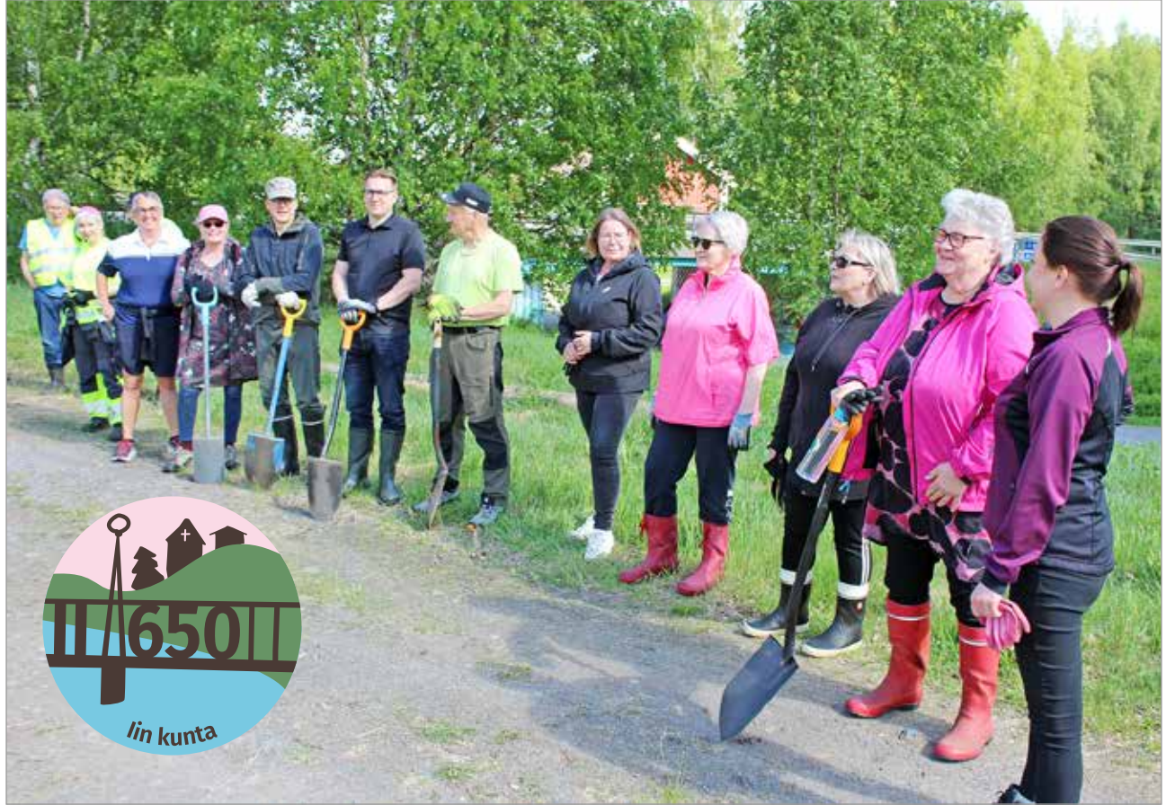
Iin kunnanvaltuutetut kokoontuivat maailman ympäristöpäivän aattona istuttamaan ensimmäiset 100 puuta. Kaikkiaan vuoden aikana istutetaan 650 puuta Iin keskeisten liikenneväylien varsille.