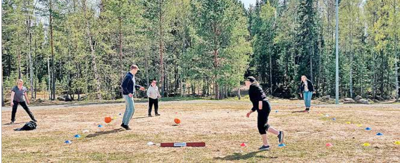
Hihtostadionilla pelattiin polttopalloa.

Iin kehitysvammaisten Tukiyhdistys ry järjesti lauantaista 25.5. kesätapahtuman Illinsaareissa. Ihmisiä saapui runsain joukoin viettämään yhteistä kesälauantaita erilaisten pihapeliin, karaoken ja yhdessä olon merkeissä. Mukana ollut Mörkö-poni ajelutti kyytiläisiä, porkkanapalkalla tietysti.