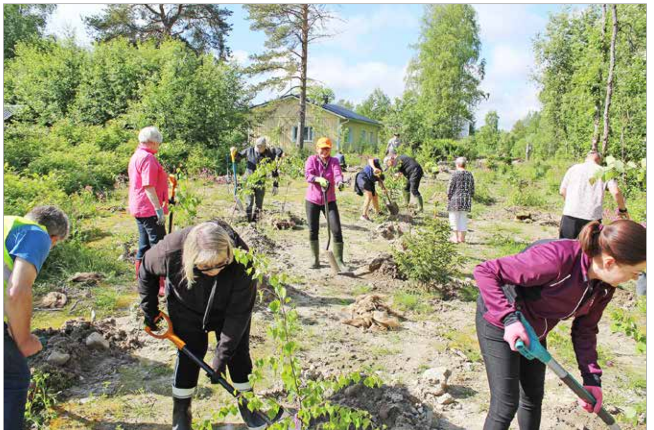
Reippaaseen tahtiin 60 rauduskoivua, 20 metsäkuusta ja 20 hybridihaapaa löysivät kasvupaikkansa. Hybridihaapa on Euroopassa esiintyvän metsähaavan ja pohjoisamerikkalaisen amerikanhaavan risteymä, jota viljellään koristepuuna. Se on nopeakasvuisin puulajimme.

Puiden istuttaminen jatkuu syksyllä, jolloin myös kuntalaisille tarjotaan mahdollisuutta osallistua. MTR