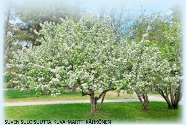
SUVEN SULUISUUTTA.

lukijoiden palaute ja jutut: vkkmedia@vkkmedia.fi