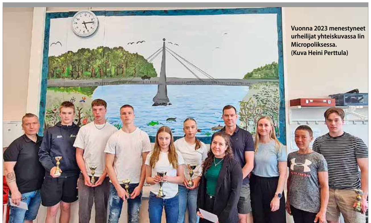
Vuonna 2023 menestyneet urheilijat yhteiskuussa Iin Micropoliksessa.