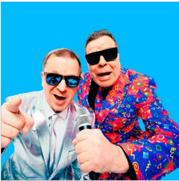
Illan pääesiintyjä on Mato Valtonen & Jore Marjaranta Band