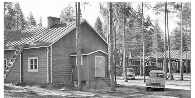
Vuornoskankaan metsäkämpät 1960-luku.