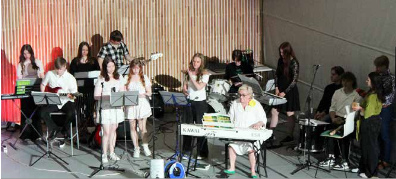
Lukion bändikurssi esitti juhlassa muun muassa kappaleen "Kesäyö".