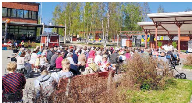
Perhetorimessua vietettiin aurinkoisella ja lämpimällä torilla.