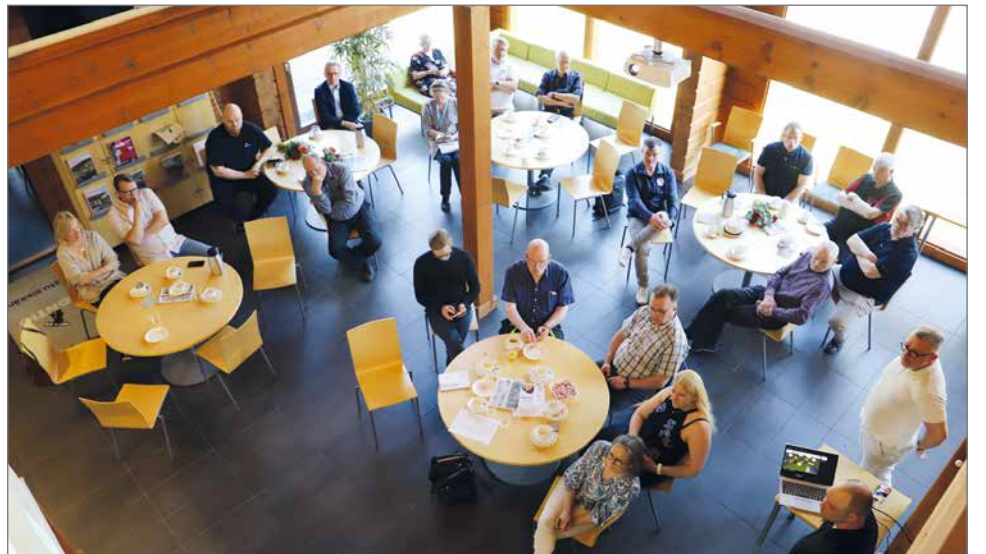
Yrittäjien aamukahveille Kontiotuotteella osallistui kolmisenkymmentä henkilöä.