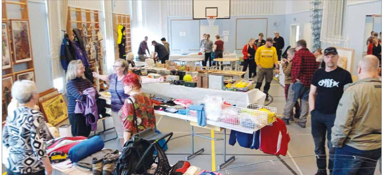
Hirppiskirppisellä tehtiin löytöjä ja tavattiin tuttuja.

ja luokkaretkirahastoon pitämällä ruokalassa kahviota. Siellä pääsi nauttimaan monenlaista suolaista ja makeaa herkkua kahvin tai mehun kanssa. Sisällä liikuntasalissa arpajaispöytä notkui hienoja palkintoja, joita monet yritykset ja yksityiset henkilöt lahjoittivat. Palkintojen joukosta löytyi mm. täytekkä, uistimia, avokeloja, lippalakki, lampaantalja, kakkuja, halkokassi ja paljon muuta. Luontoaiheisessa tietovisassa pääsi testaamaan luontotietoutta tunnistustehtävien parissa.