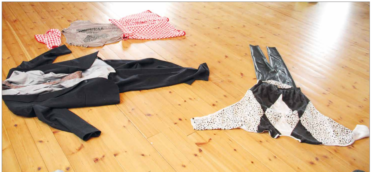
Laihanlaisia ja jopa laiskoja ovat nämä hahmot.