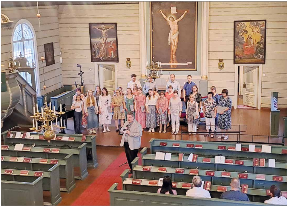
Tilaisuuden lopuksi kuulijakunnan korvia hiveltiin kaikkien kuorojen yhteisesityksellä.