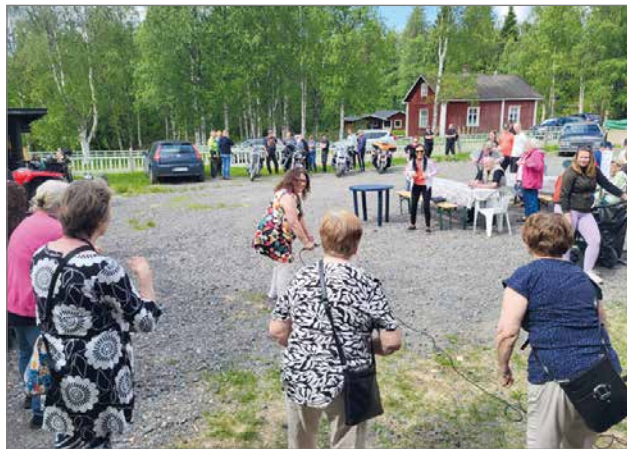
Liikettä kehoon nenäliinajumpan keinoin. Harrikkaporukka seurasi juppaa tautalla.