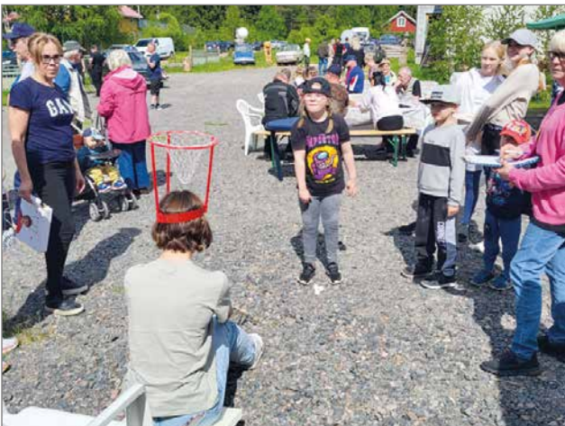
Päägolfinpelaaminen oli tarkkaa hommaa.