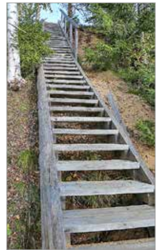
Portaat Iijoen rannasta laavulle Purusaarella. Portaita oli nelisenkymmentä askelmaa.