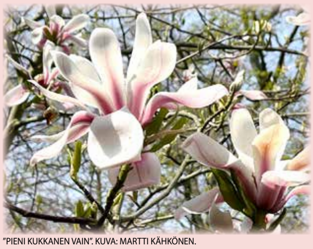
"PIENI KUKKANEN VAIN".

lukijoiden palaute ja jutut: kahkonen.martti@gmail.com