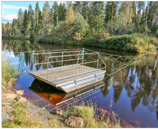
Köysilossilla oli jännä ja kätevä ylitys 20 metrin vesiosuus. Lossi lipui eteenpäin valkoisesta köydestä vetämällä. Yletöntä voimankäyttöä ei tarvittu.