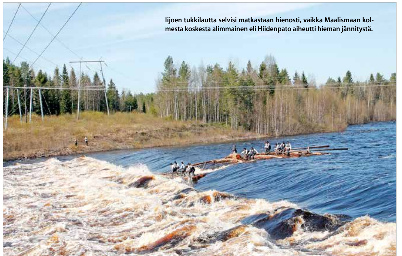
Ijoen tukkilautta selvisi matkastaan hienosti, vaikka Maalismaan kolmesta koskesta alimmainen eli Hiidenpato aiheutti hieman jännitystä.