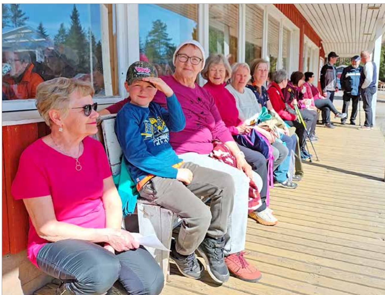
Tänä vuonna aurinkoinen, lämmin sää helli Illinsaassa. Se näkyi iloisina ilmeinä tapahtumaan osallistuneiden kasvoilla.