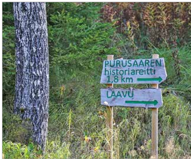
Opasviitta rannan tuntumassa neuvoi kiertämään rengasreitintä vastapäivään. Laavulle oli tästä paikasta matkaa puolisen kilometriä. Nettitietojen mukaan reitille on tulossa historiasta kertovia opastauluja.

Iin erinomaisten ulkoilu-kohteiden joukosta yksi erikoisimmista on Purusaaren reitti Jakkukylässä. Purusaaren maisemareitti on yhdysreitteen noin 2,4 kilometrin mittainen ja sitä ylläpitää Jakkukylän kyläyhdistys.