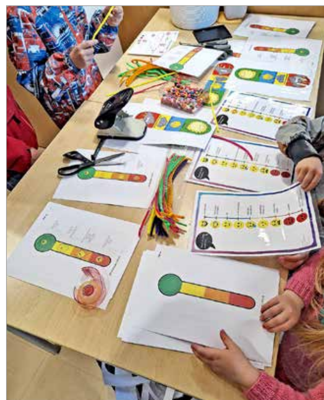
Nepsy pop up-tapahtuman viisiosaisella tunnepolulla tutustuttiin muun muassa erilaisiin tunteiden ilmaisuun liittyviin työkaluihin ku- ten tunnemittareihin ja liikennevalonauhoihin.

- Hanke päättyi viralli- sesti kesäkuussa, muttahan- keella saimme koulutettua kuusi nepsy-valmentajaa, jotka voivat alkaa nyt suun- nitella tulevaa toimintaa ku- ten vertaisryhmiä, Lehtola kertoo. JK