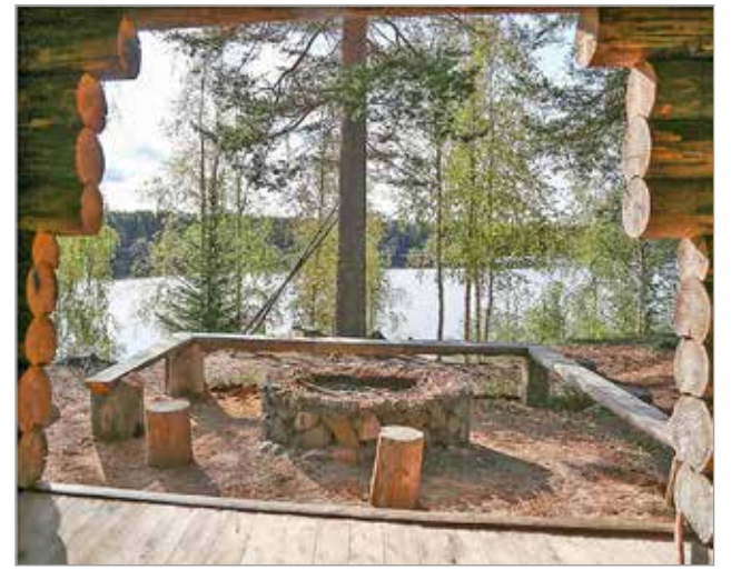
Laavu oli rakennettu saaren länsipäähän avarien jokimaisemien äärelle. Laavun ja puuliiterin läheltä pääsi jokirantaan jyrkkiä portaita pitkin.