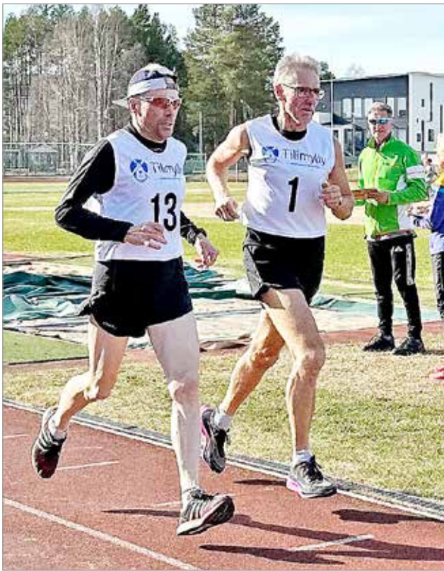
Iin Pekat, Kukkula ja Kuokkanen vauhdissa.

M40 10000 m: 1) Kyösti Kujala Oulu 39.17,8, 2) Jouko Perttula IiY 52.21,0