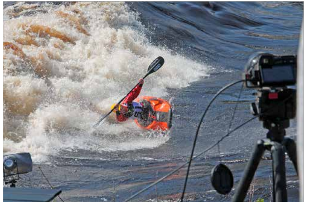
Koskimelonnan Suomi Cupin osakilpailu myös striimattiin suorana YouTubeen. Video on edelleen nähtävillä Freestyle Suomi-Cup -tilillä.