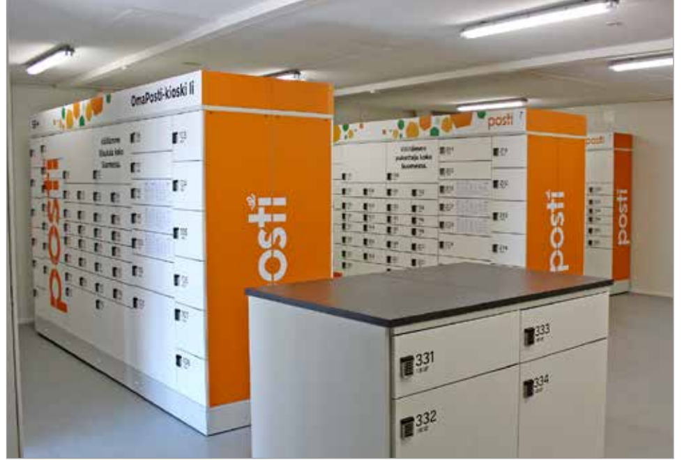
Iin OmaPosti-kioskissa on 400 lokeron pakettiautomaatti.

OmaPosti-kioskin Posti lanseerasi vuonna 2019 ja niitä on sen jälkeen avattu muutamia vuodessa. MTR