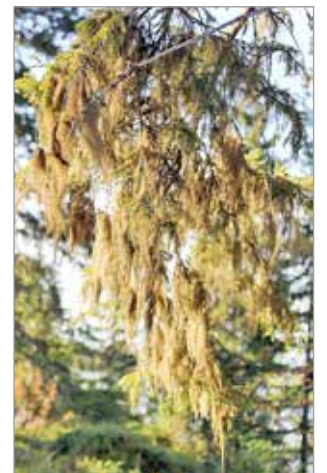
Matkan varrelle osui muutama hyvin, hyvin naavainen/lup-painen kuusi.