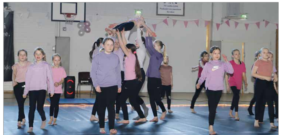
Kansalaisopiston showtanssi: Timantte.