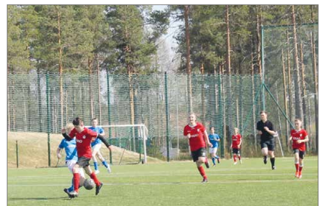
Kurenpoikien seitsemällä juniorijoukkueella oli viikonvaihteessa 15 peliä.