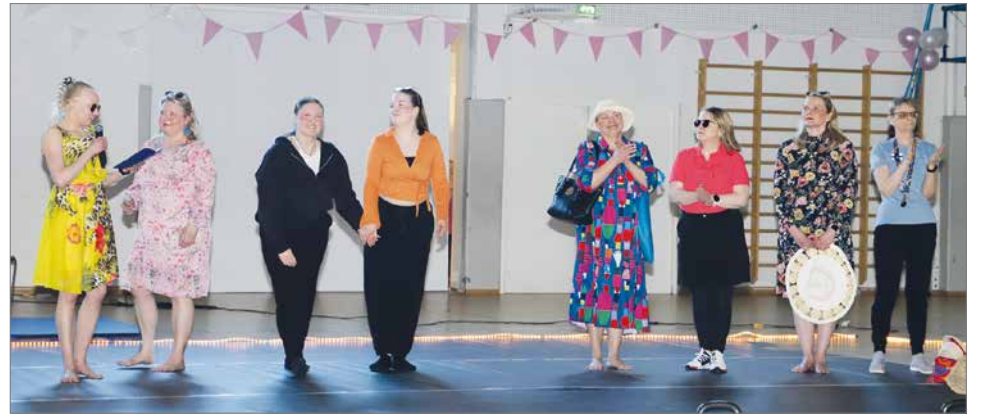
Voimistelujoukoston johtokunta: Fireball.

Tulevaa jumppasyksyä odotellen, Voimistelujoukoston johtokunta, kuvat Heimo Turunen