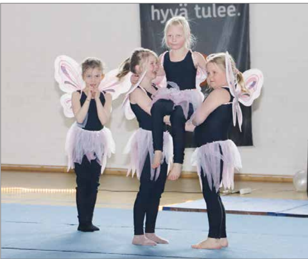
Voimistelujoukoston voimistelukoulu 6-8-vuotiaat: Kevätperhoset.

sia myös vanhempi - lapsi kenttäohjelmiin osallistumiseen.