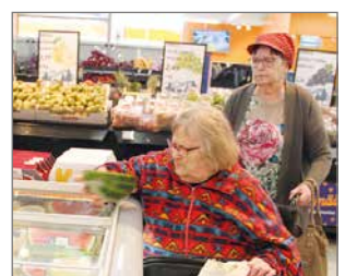
Isot kylmäaltaat tuottavat vaikeuksia syvyytensä vuoksi. Huonoilla käsiavoimilla asiakas ei jaksanut nostaa neljännes vesimelonia ilman avustajaa.