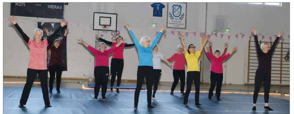
Eläkeliiton ikiliikkujat: Letkeästi liikkuen.