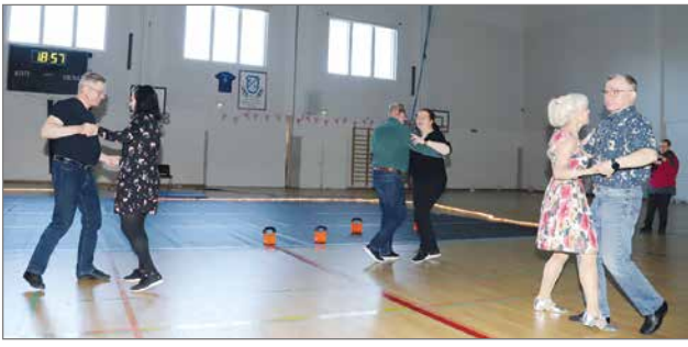
Kansalaisopiston lavatanssiryhmä esittää kepeästi kohti kesälavojaa.

Näytöksessä muisteltiin myös hetkiä menneeltä voimisteluvuodelta. Viime kesänä neljä naista oli mukana Alankomaiden Amsterdaminissa järjestetyssä World Gymnaestrada -tapahtumassa. Naiset esiintyivät useamman sadan suomalaisen voimistelijan kenttänäytösohjelmassa Kirkkaat vedet, joka esitettiin yhteensä kolmena päivänä tapahtuman aikana. Näitä Gymnaestrada -tapahtumia on lähivuosina taas tulossa, sillä Joensuun Gymnaestrada järjestetään vuonna 2026 ja seuraava maailmanlaajuinen World Gymnaestrada portugalilaisessa Lissabonissa 2027. Etenkin Joensuun 2026 tapahtumaa silmällä pitäen kaikki innokkaat toivotaan mukaan lapsista aikuisiin. Kansallisessa Suomen tapahtumassa on helppoja mahdollisuuksia myös vanhempi - lapsi kenttäohjelmiin osallistumiseen.