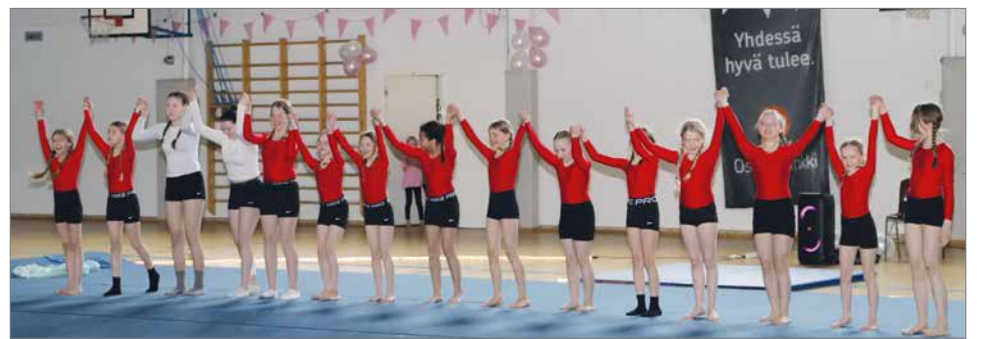
Voimistelujoukoston voimistelukoulu 9-12-vuotiaat: Myrskyä ja iloa.