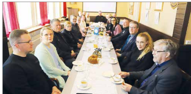
LC Pudasjärven huhtikuun klubikokous oli samalla vuosi-/vaalikokous, jossa vahvistettiin tulevan kauden hallitus ja virkailijat.