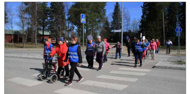
Liikenneturva oli mukana Invalidiliiton Helppo liikkua -viikon tapahtumissa.

Leikkelehyllystä on mahdotonta saada ylempänä olevia tuotteita ilman avustajaa tai apuvälinettä.