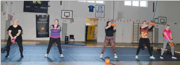
Voimistelujoukoston tehotreeni: No Rules.