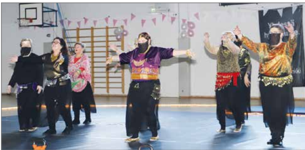
Kansalaisopiston itämainen tanssi: Tanssien vahvaksi.