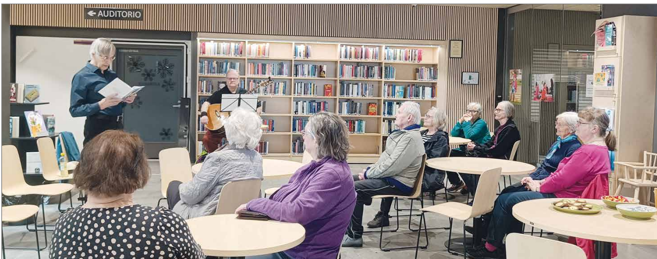
Kuulemaan saapui kymmenkunta runouden ystävää.