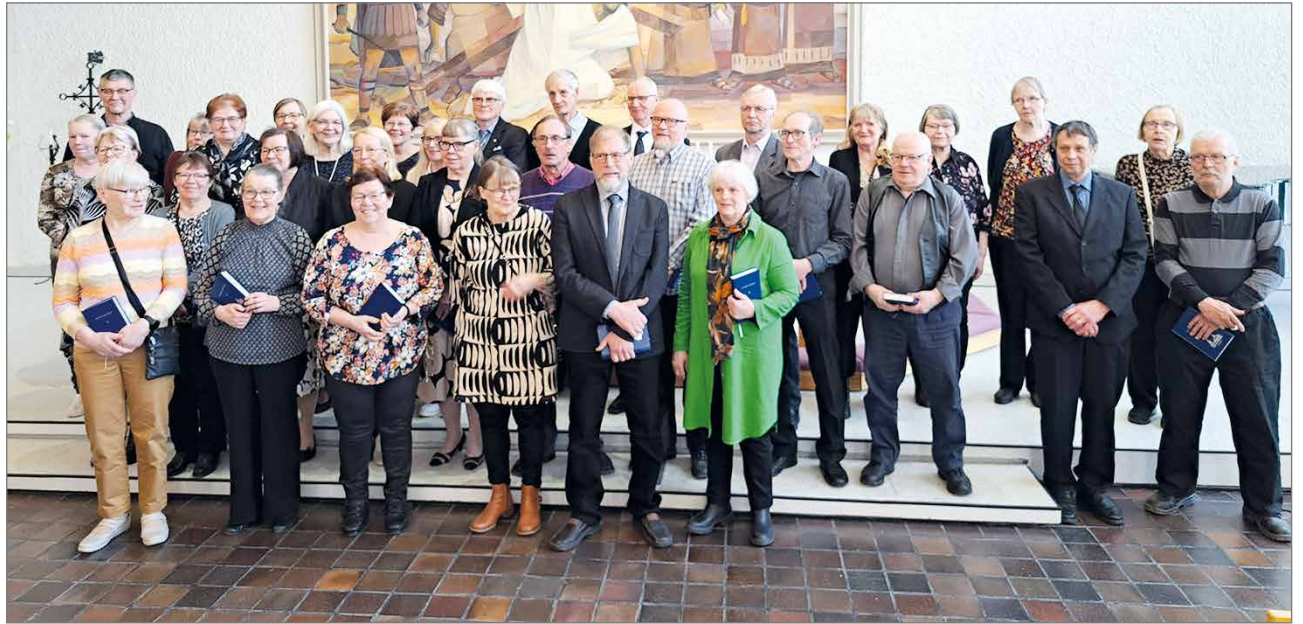
Tänä vuonna 70-v merkkipäivää viettäviä seurakunta muisti helatorstaina.

Siunaus toimitettu läheisten läsnä ollessa 17.5.2024. Lämmin kiitos osanotosta. Kiitämme äidin hoitoon osallistuneita