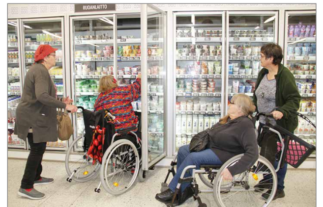
Kylmäkaapista tavaroiden ottaminen on vaikeaa pyörätuolista käsin. Liukuovikaappi helpottaisi jonkin verran tilannetta, mutta ei auta ylähyllyltä tavoittelemiseen.