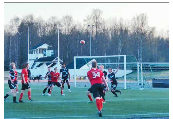
Kurenpoikien miesten joukkue otti kauden avausvoiton Nelosessa.

kuin kahdessa edellisessä pelissä. Puolustuspelaaminen toimi yllättävän hyvin ja avausvoitto on tietenkin hen-